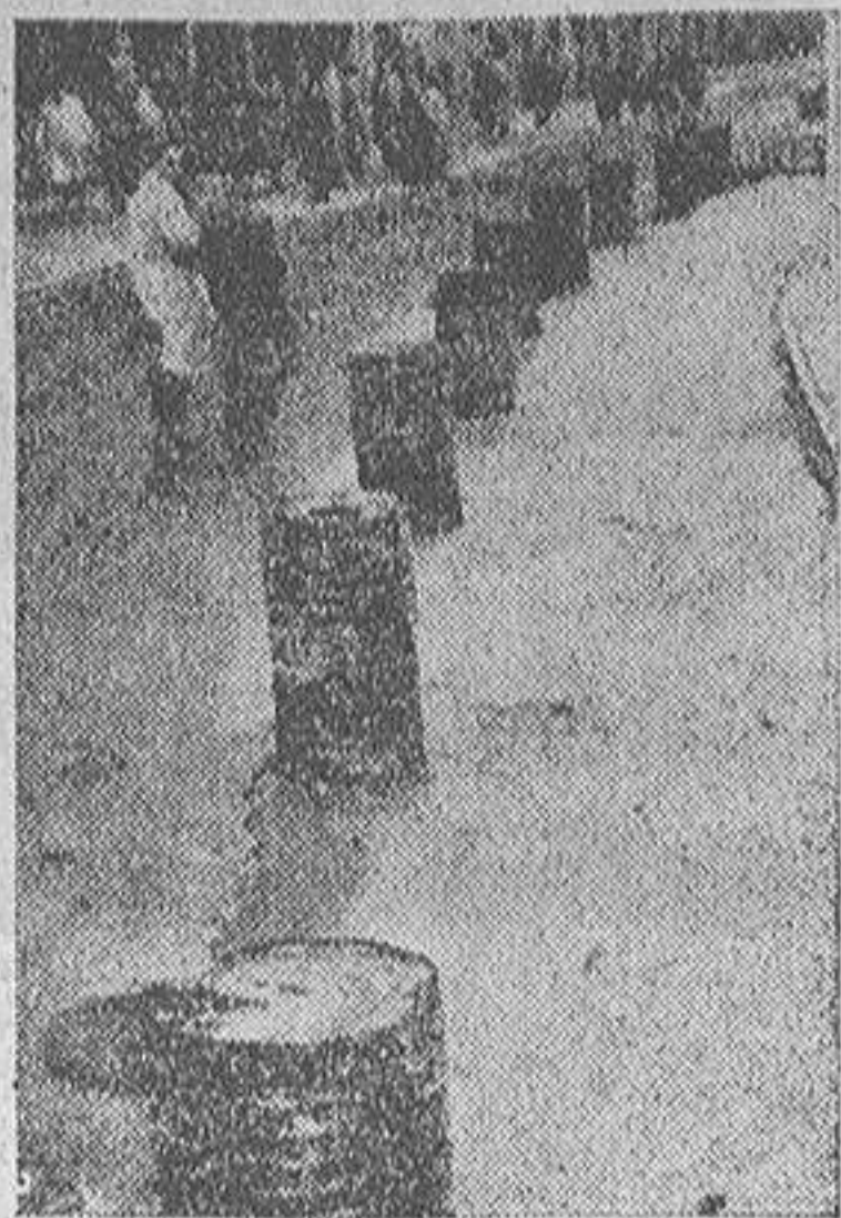
Esos hidones que jalonan la hermosa Avenida de la Marina no son todavía los que nos traen el prometido acceite para el racionamiento extra.