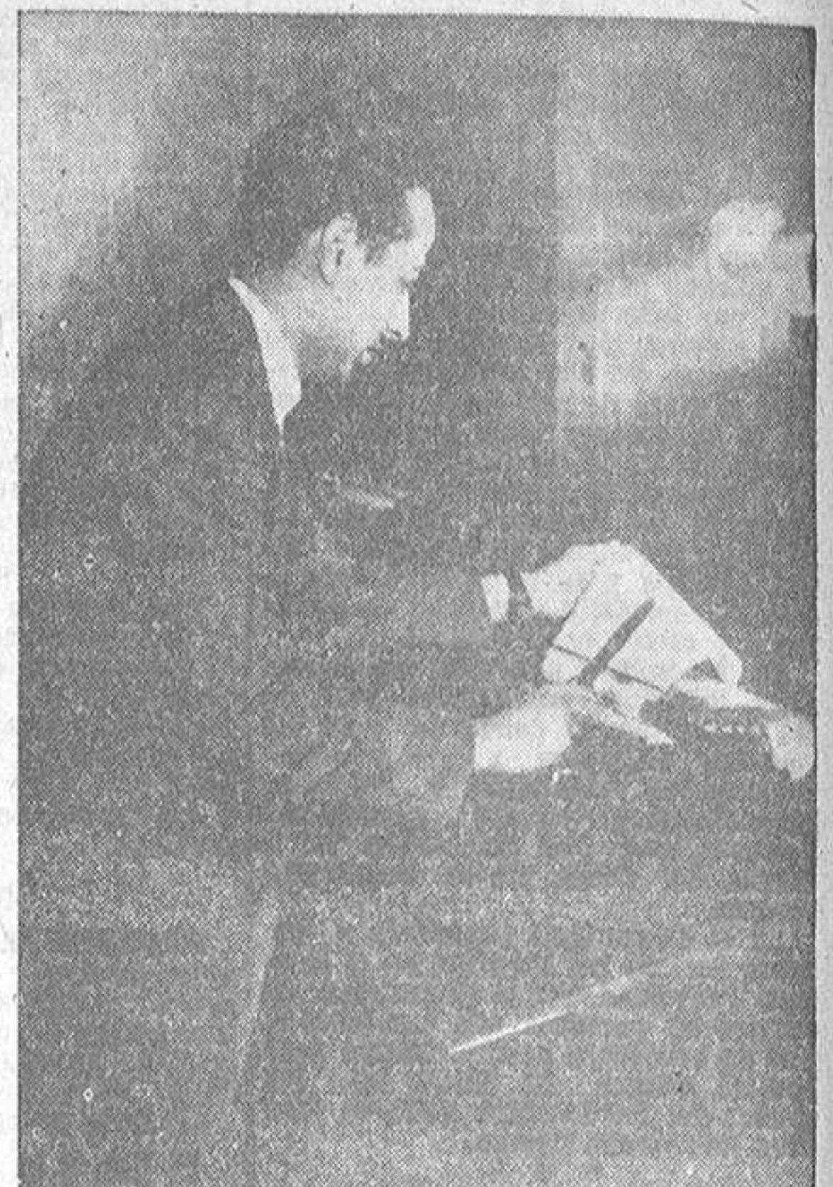
El teletipo, esa ruidosa máquina que siempre suele estropearse en el momento más inoportuno, es el redactor más imprescindible en todo periódico. Ella trae a La Coruña amplia información de lo que acaso ha sucedido diez minutos antes en Nueva York o Bombay. El teletipo destrerró el teléfono y el telégrafo como elementos clave en el periodismo de antaño