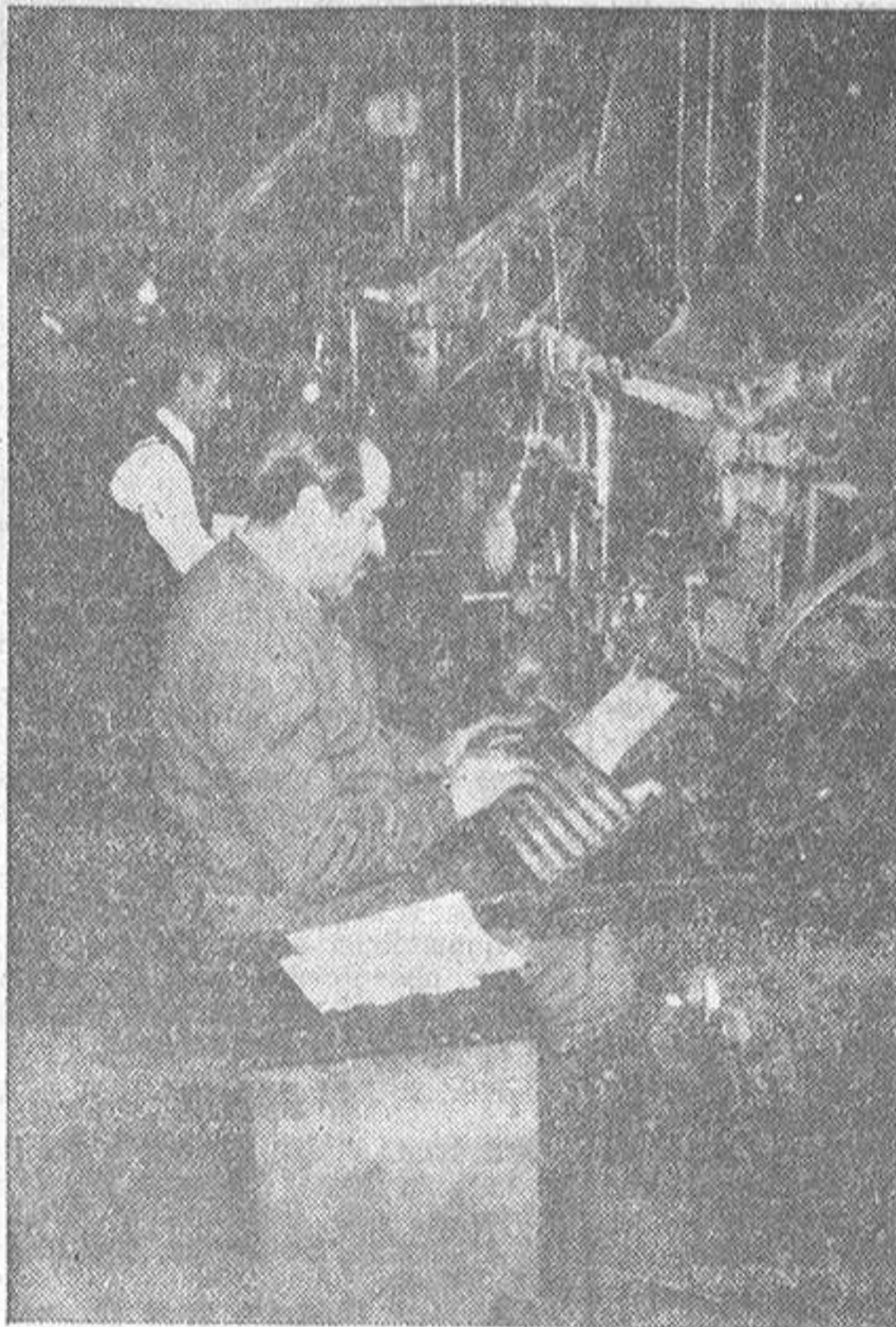
Los linotipistas son esos elementos fundamentales en todo periódico, que van escribiendo en líneas de plomo todo lo que arriba, en la redacción, acaban de escribir en tinta de máquina los redactores. El reloj suele marcar las cuatro de la madrugada cuando, en días normales, cesa en los talleres el familiar ruido de las linotipias