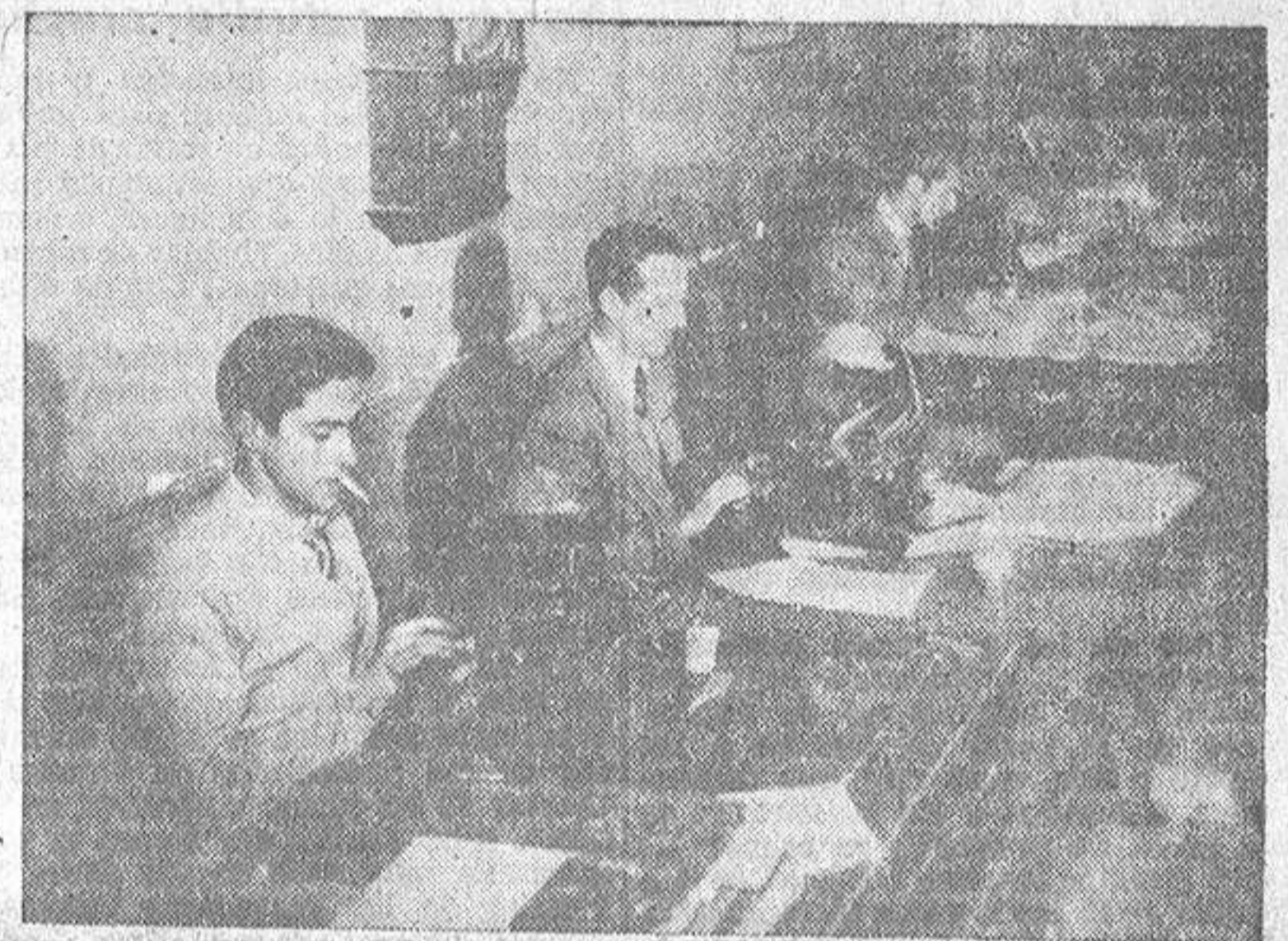
Bien entrada la madrugada, cuando la ciudad duerme apaciblemente, los periodistas escriben y transcriben todo aquello que usted leerá por la mañana, como el elaborado resumen de la historia del mundo en las últimas veinticuatro horas.

El periódico es la historia del mundo cada 24 horas