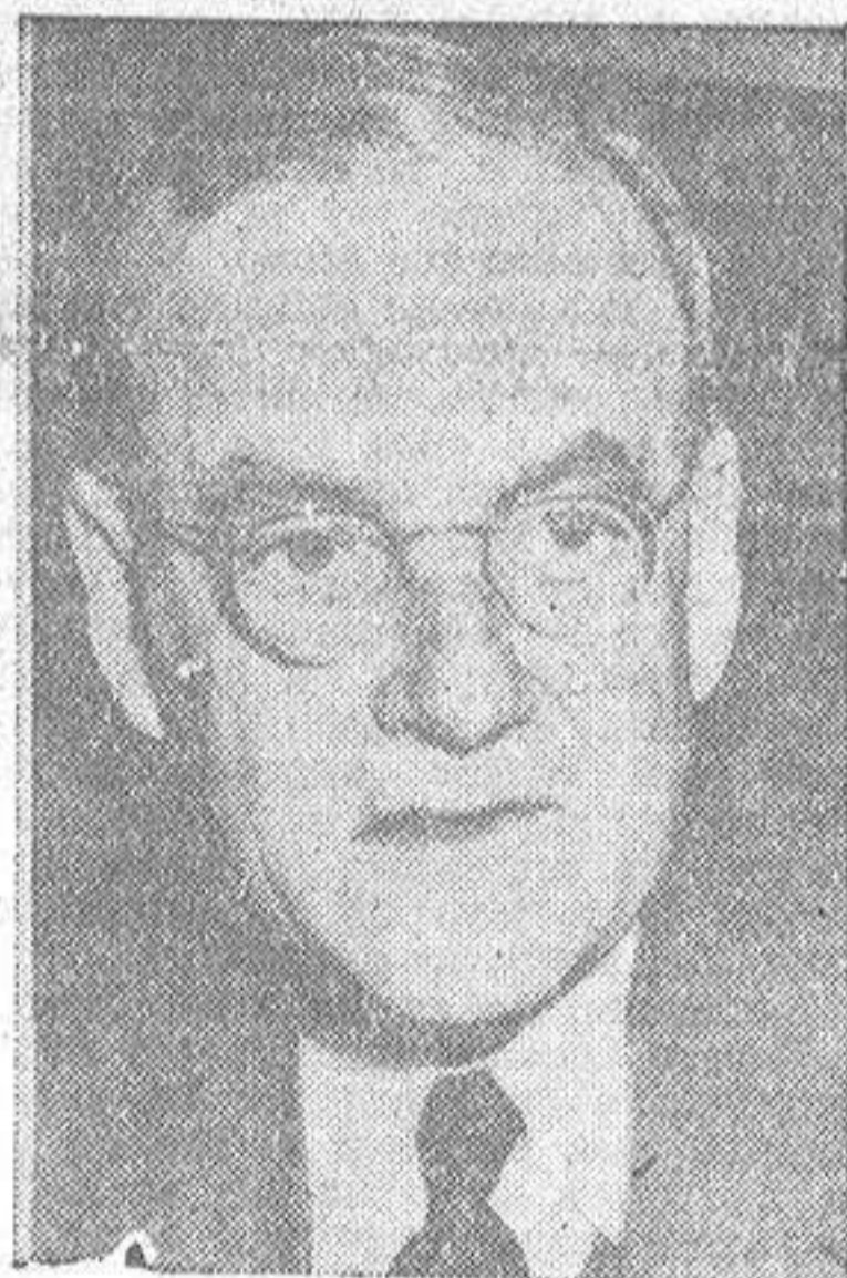
JOHN FOSTER DULLES

El Secretario de Estado regresó a Washington, después de hablar ante la Comunidad Europea del Carbón y del Acero