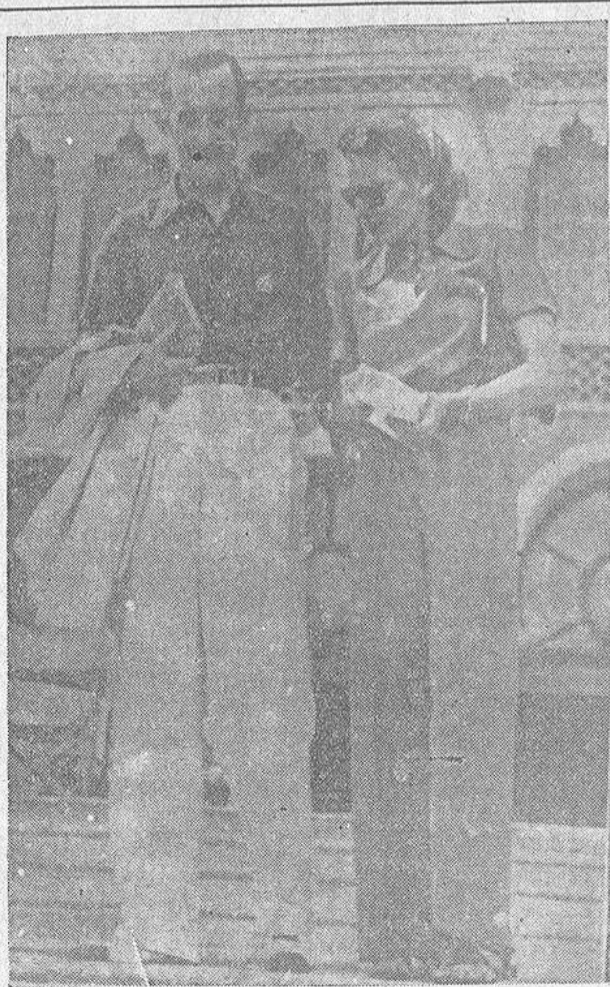
La hija mayor de Mussolini, Edda, esposa del ministro de Negocios Extranjeros de Italia, Conde Ciano, en la playa de Lido, en Venecia. Según su afirmación, Edda es la principal colaboradora de su padre, quien oye la opinión de aquella en última instancia y en los momentos culminantes de la política europea.

Fotos, carnets, kilómetros, pasaportes, embarques y toda clase de documentos DOS FOTOS, DOS, 0,90 Entrega de un día para otro y en el acto Franja, 61 Próximo calle Real