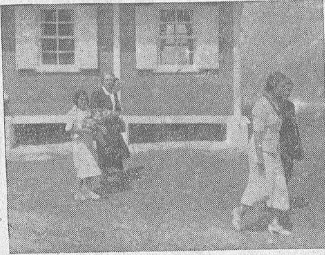
La esposa del Generalísimo con su hija Carmencita, en la playa de Bastiaqueiro

Al tomar notas amplias de la jornada vemos que todos los objetivos se han logrado plenamente, con el aplastamiento de los núcleos defensivos y captura de un buen número de prisioneros.