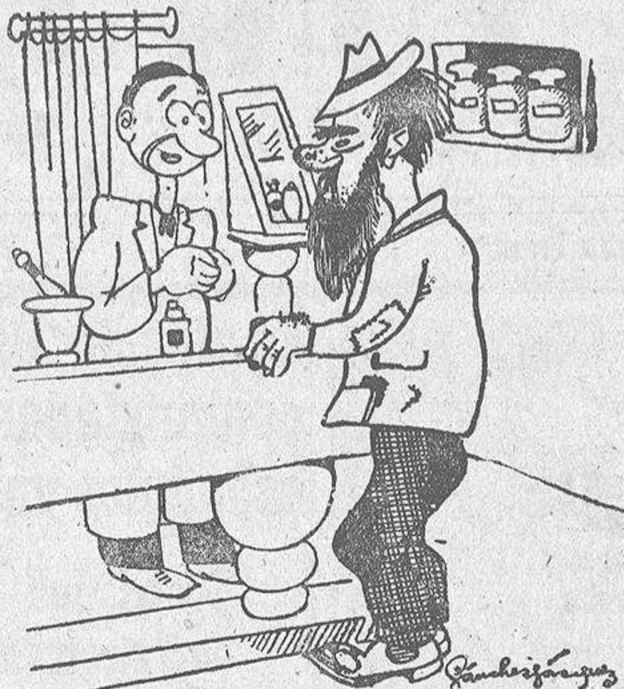
—Déme usted diez céntimos de polvos insecticidas. —¿Los envuelvo o los va usted a llevar puestos?