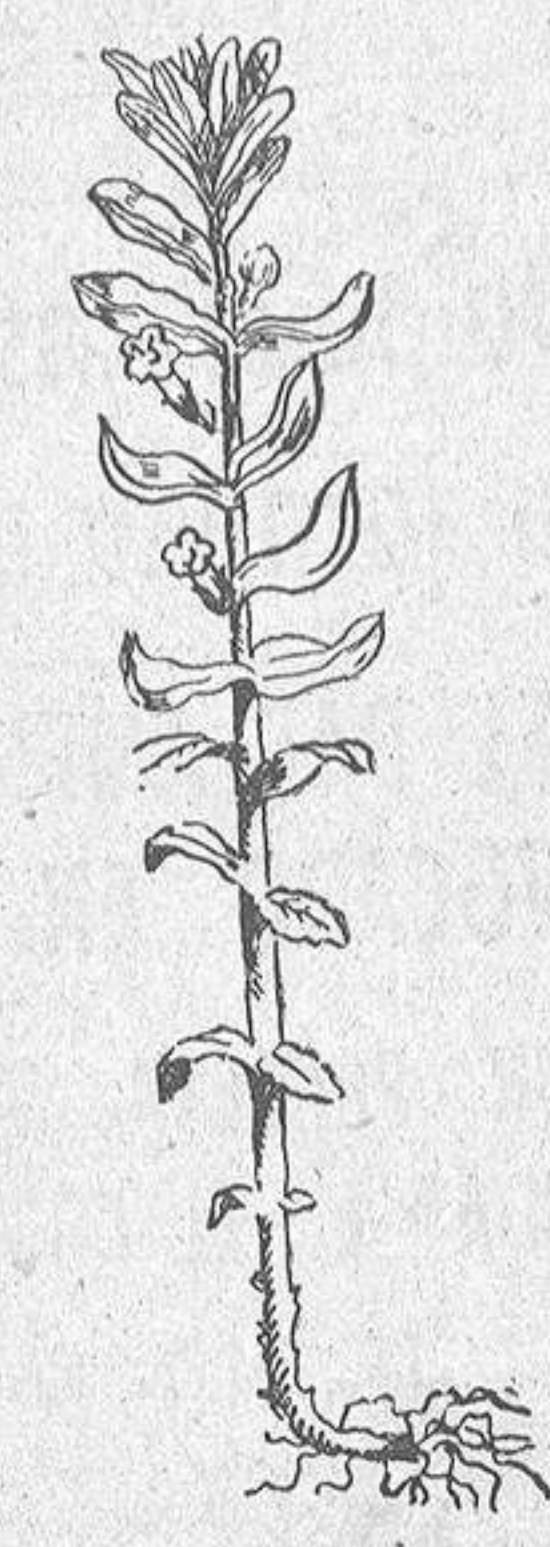
GRACIOLA, hierba de las calenturas

Algún día hablaremos de uno o dos importantes proyectos próximos a convertirse en realidad — que realizarán dichos organismos. Que para cansar la paciencia del lector, ya bastó con lo de hoy.