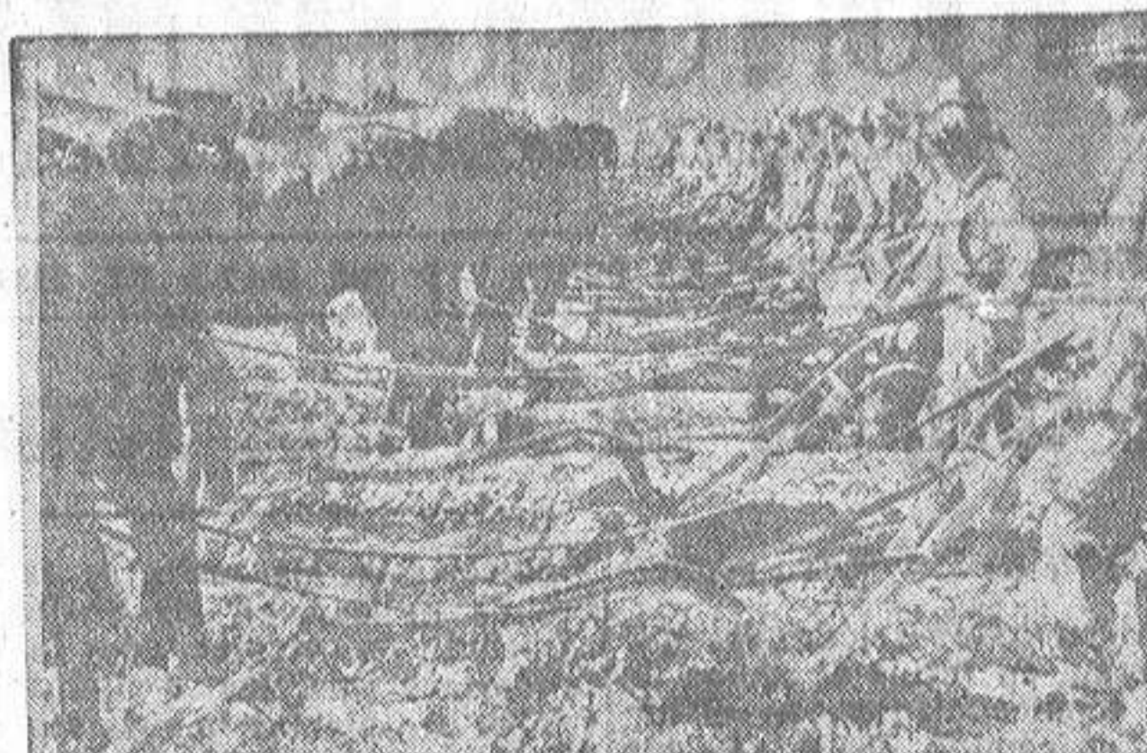
Labradores enviados por el Gobierno norteamericano para trabajar las tierras neutras de Arizona

Casa mortuoria: Santa María 22, primero. GRAN FUNERARIA