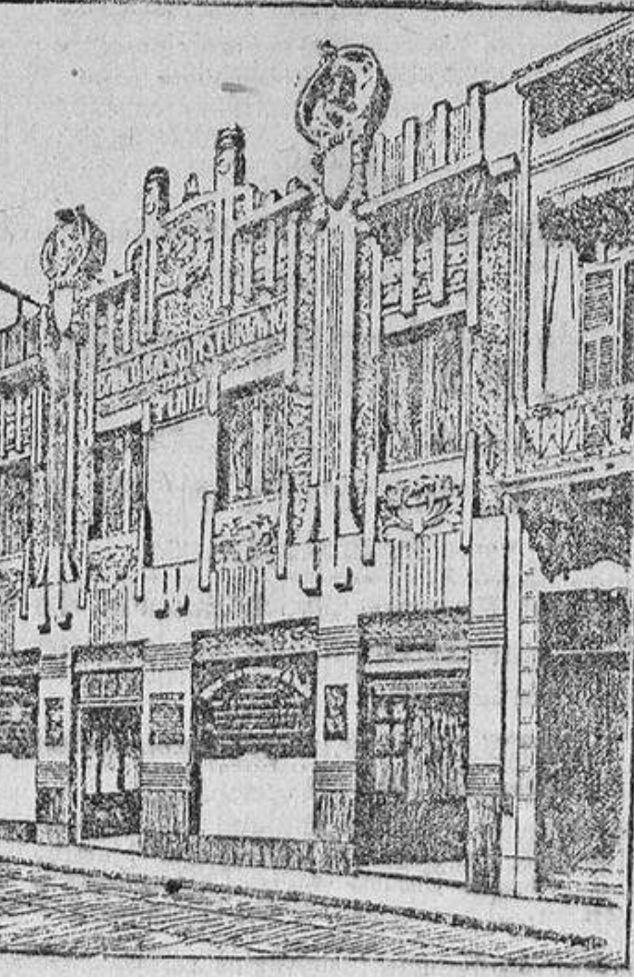
EDIFICIO DEL BANCO

Los grandes Mercados del Plata consumen anualmente del Extranjero productos por valor de 500 millones de pesos oro, y de España sólo 14.