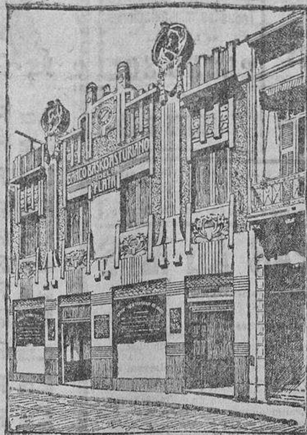
EDIFICIO DEL BANCO