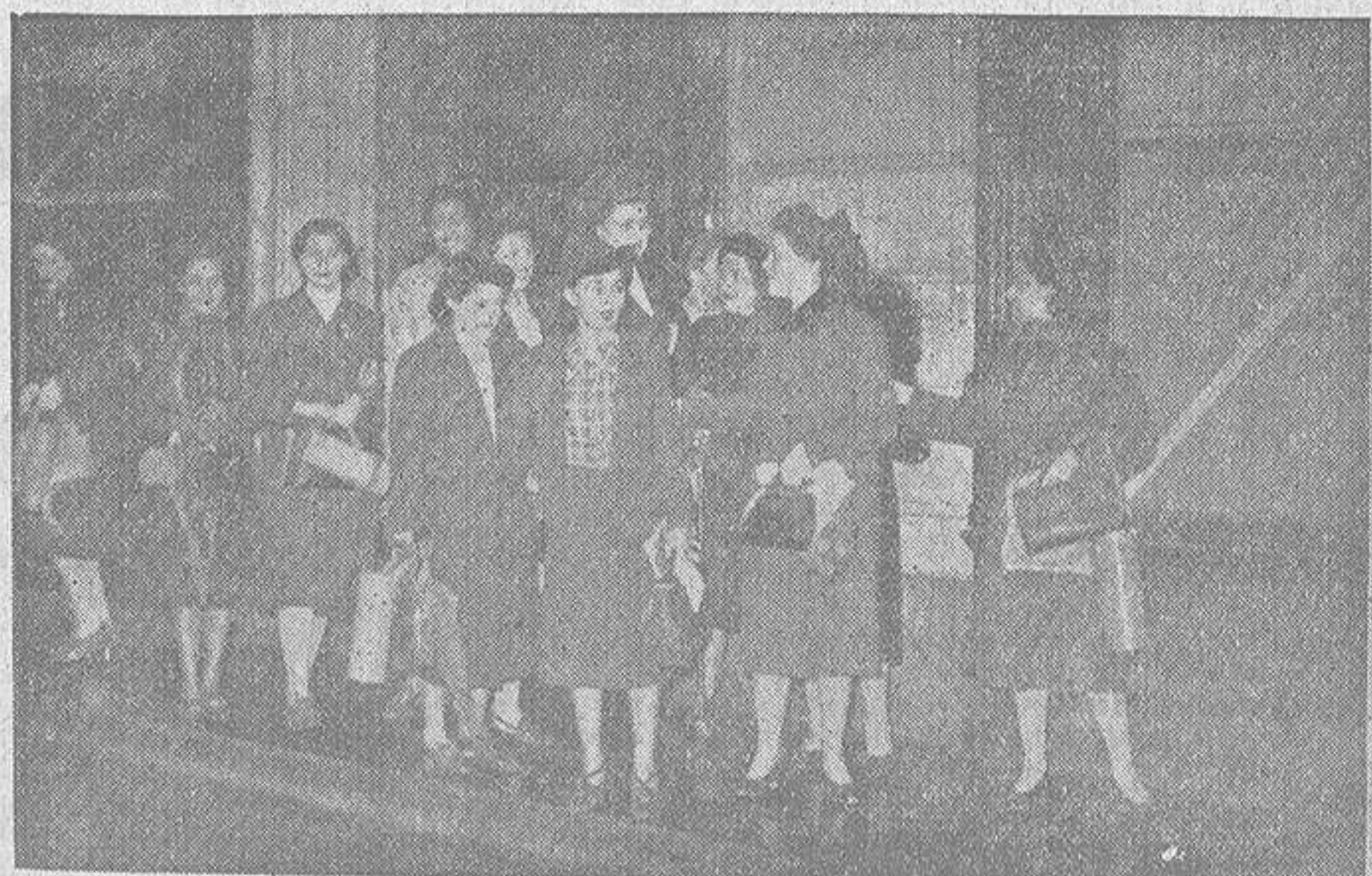
En París hasta las modistillas acuden al taller provistas de la correspondiente máscara anti-gas. ¡Por si las moscas!, como diría un castizo.