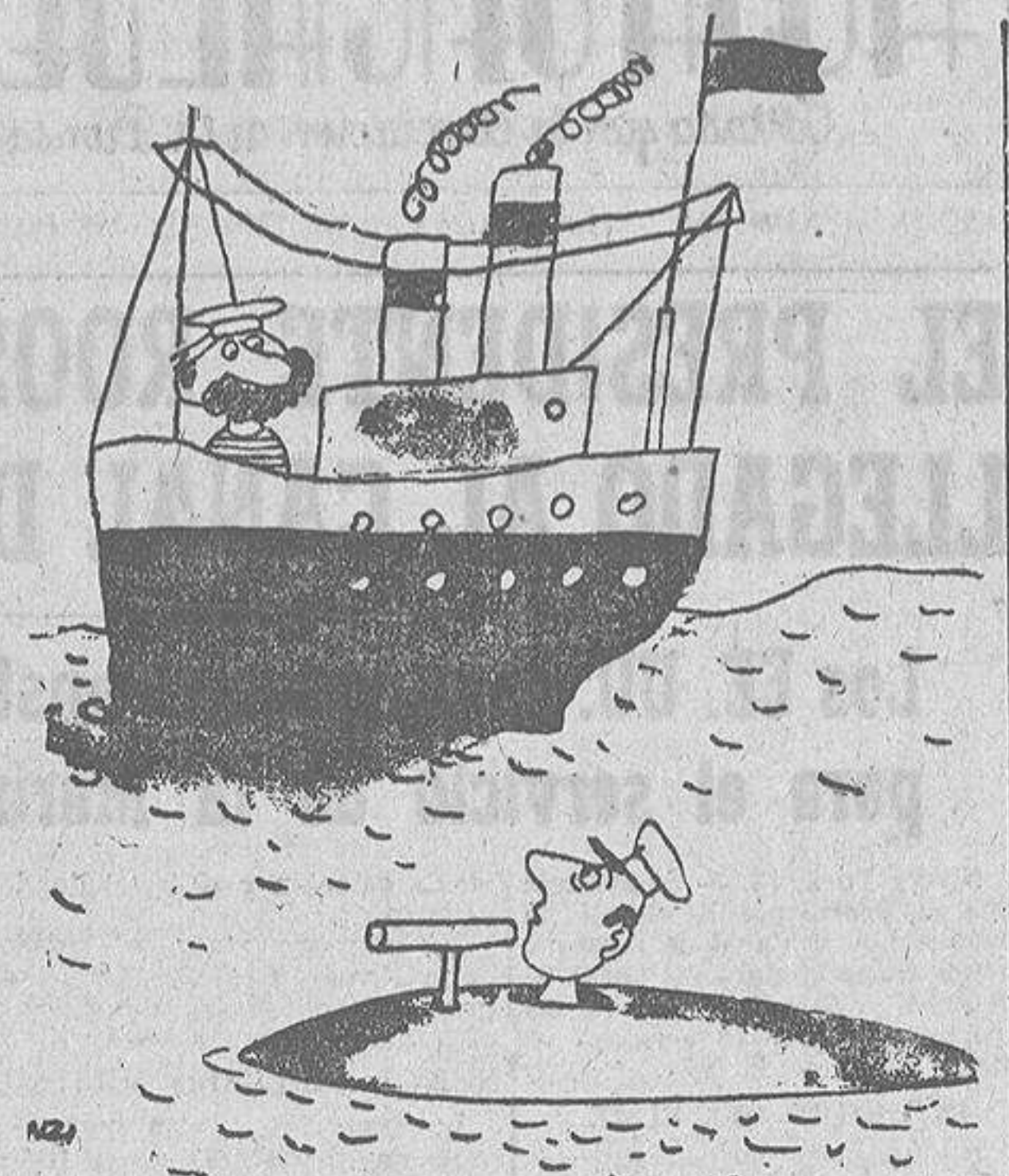
—¡Eh! Torpedear con delicadeza que el barco transporta huesos frescos.

Puentecures (Pontevedra) 19 de febrero de 1940.