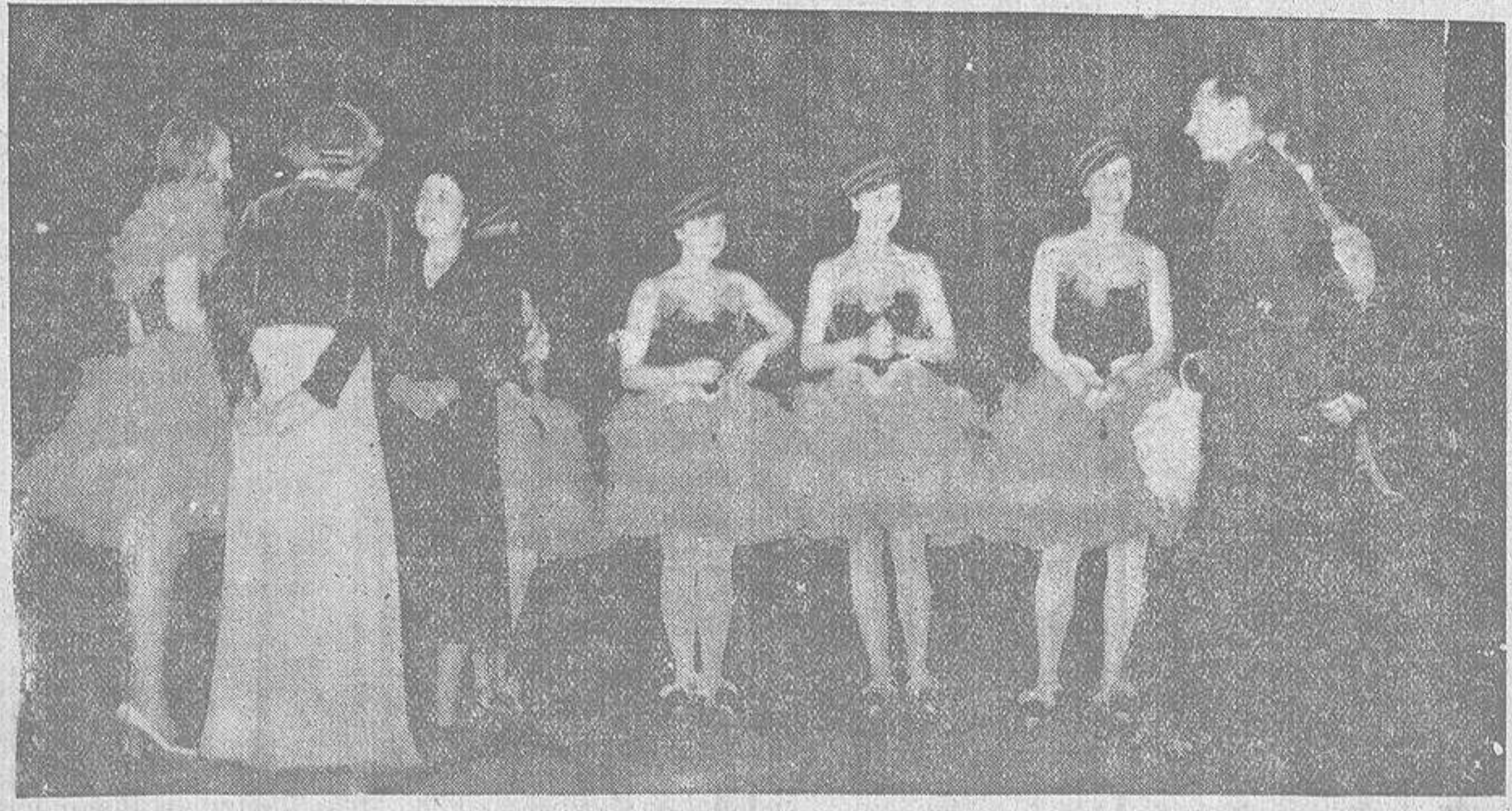
En Inglaterra se forman continuamente grupos de artistas de teatro que se trasladan luego al frente británico en Francia y organizan funciones variadas para agasajar a los soldados. El Rey y la Reina en el escenario del teatro Drury Lane, de Londres, conversando con los artistas

Estambul 18. — Las noticias oficiales relativas al número de víctimas a consecuencia de los últimos terremotos en Turquía, dicen que los muertos fueron 32.000 y los heridos 9.000. Los daños materiales han sido de gran consideración, y en algunos puntos se tardará bastante tiempo en repararlos. — Stefani.