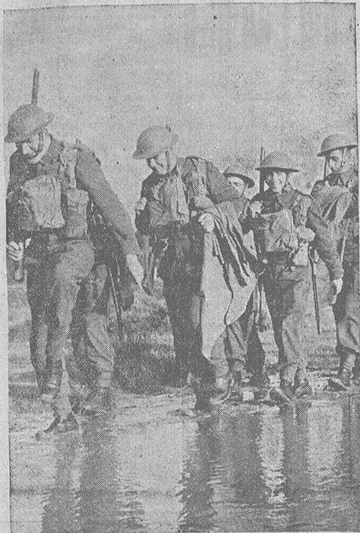
Soldados ingleses de Infantería en el frente occidental

En Salla, la situación de los soviets es dramática. Abandonan a los muertos y heridos. - El exceso de material obstaculiza la retirada. - Bélgica promete ayuda a los finlandeses