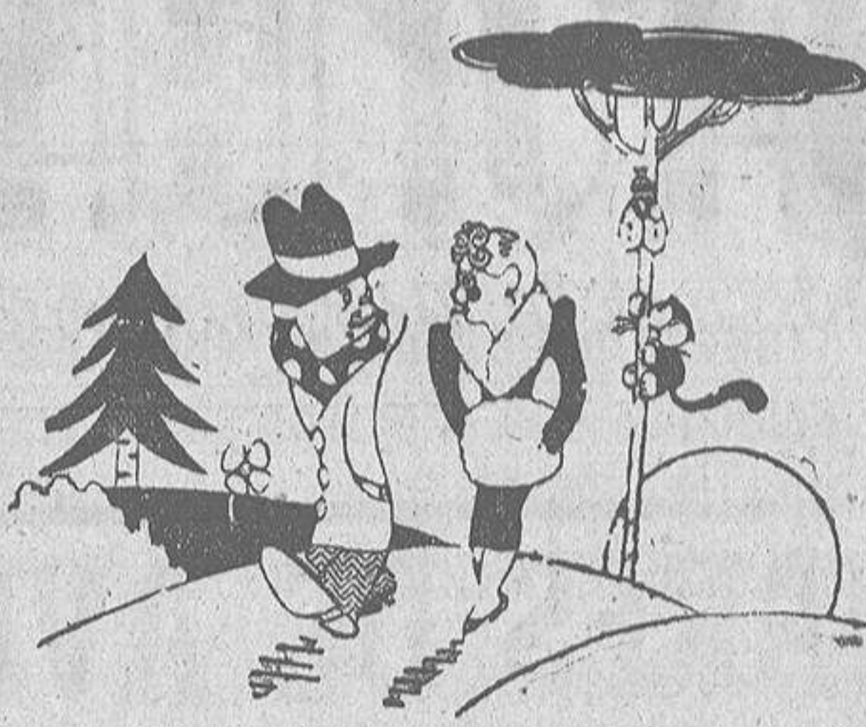
NOTA COMICA, por Miranda. —¿Qué te contestó mi papá cuando le dijiste que sólo contabas con quinientas pesetas para la boda? —Me pidió prestadas doscientas cincuenta.