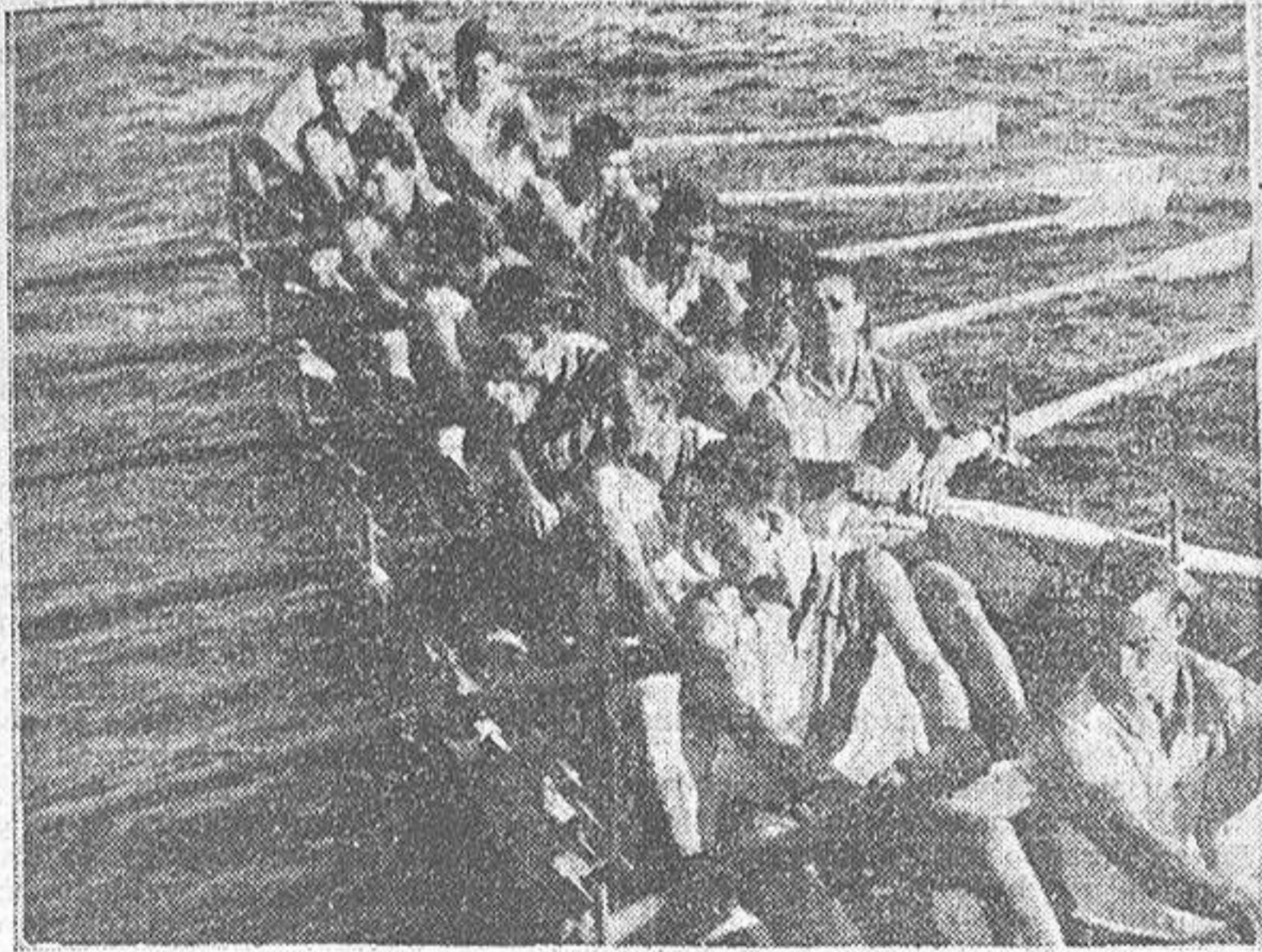
La trainera "Cabildo", de Santander, vencedora absoluta en las regatas disputadas el viernes y el domingo

En la de ayer aventajó a la "Blanca", su inmediata seguidora, en 16 segundos