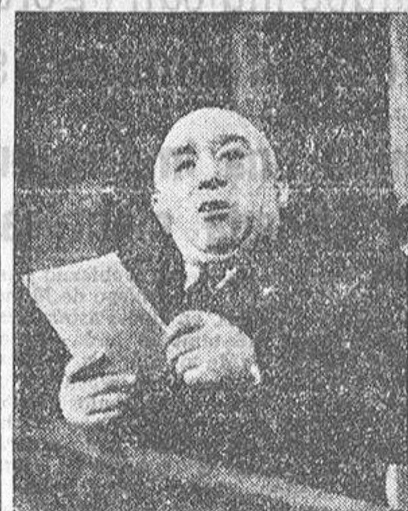
RAKOSI el dictador comunista de Hungría

Las reparaciones de Hungría habían sido fijadas en unos 300.000.000 de