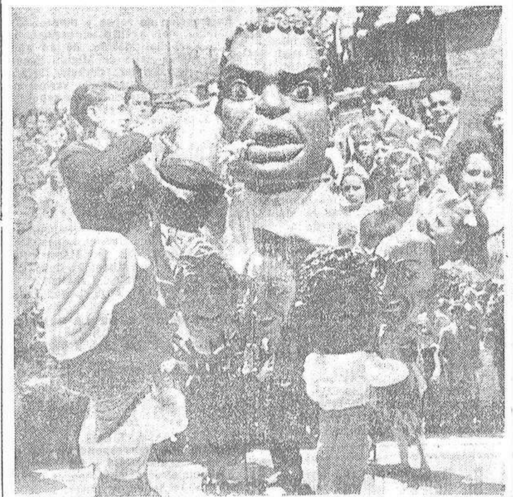
Gigantes y cabezudos pueblan de júbilo infantil las calles en fiestas. Con sus danzas grotescas, su cabeceo solemne y la agresión inofensiva del cabezudo vejeja en ristre, llevan una ilusión de cuento fantástico. Los chicos se apolpan a su paso y los mayores los miran con simpatía. Anacrónicos e inocentes, estos tradicionales monstruos de cartón y percalina, son el mejor emblema de nuestras fiestas. Mucho volumen por fuera y por dentro un hombrecillo simpático y alegre que los mueve.