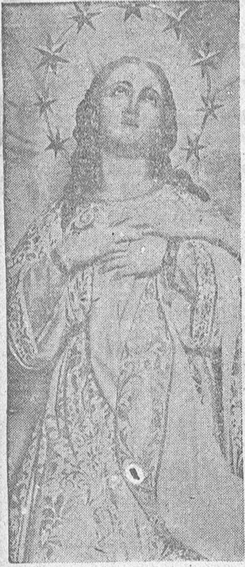
esta es María, sin llegar al centro; que el alma, sólo puede retratalla pintor que tuvo nueve meses dentro Lope de Vega.

El retrato que de la Santísima Virgen ha hecho de un modo tan delicado y definitivo, Lope de Vega, nos evita toda disculpa. Porque para poder describirla como hace el poeta, se necesita... eso... ser poeta. Y ser poeta, como un Lope de Vega (y aún así quedaría oscurecida la pintura!