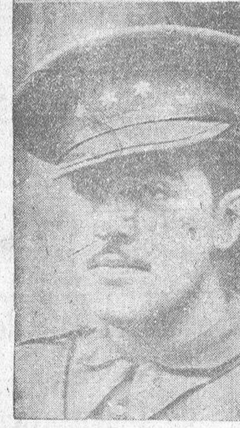
El Excmo. Sr. D. José Antonio Girón, Ministro del Trabajo

Muchas oraciones y mucha generosidad. A Dios rogando, y el bolsillo muy despierto. Menos señoritos, y más apóstoles.