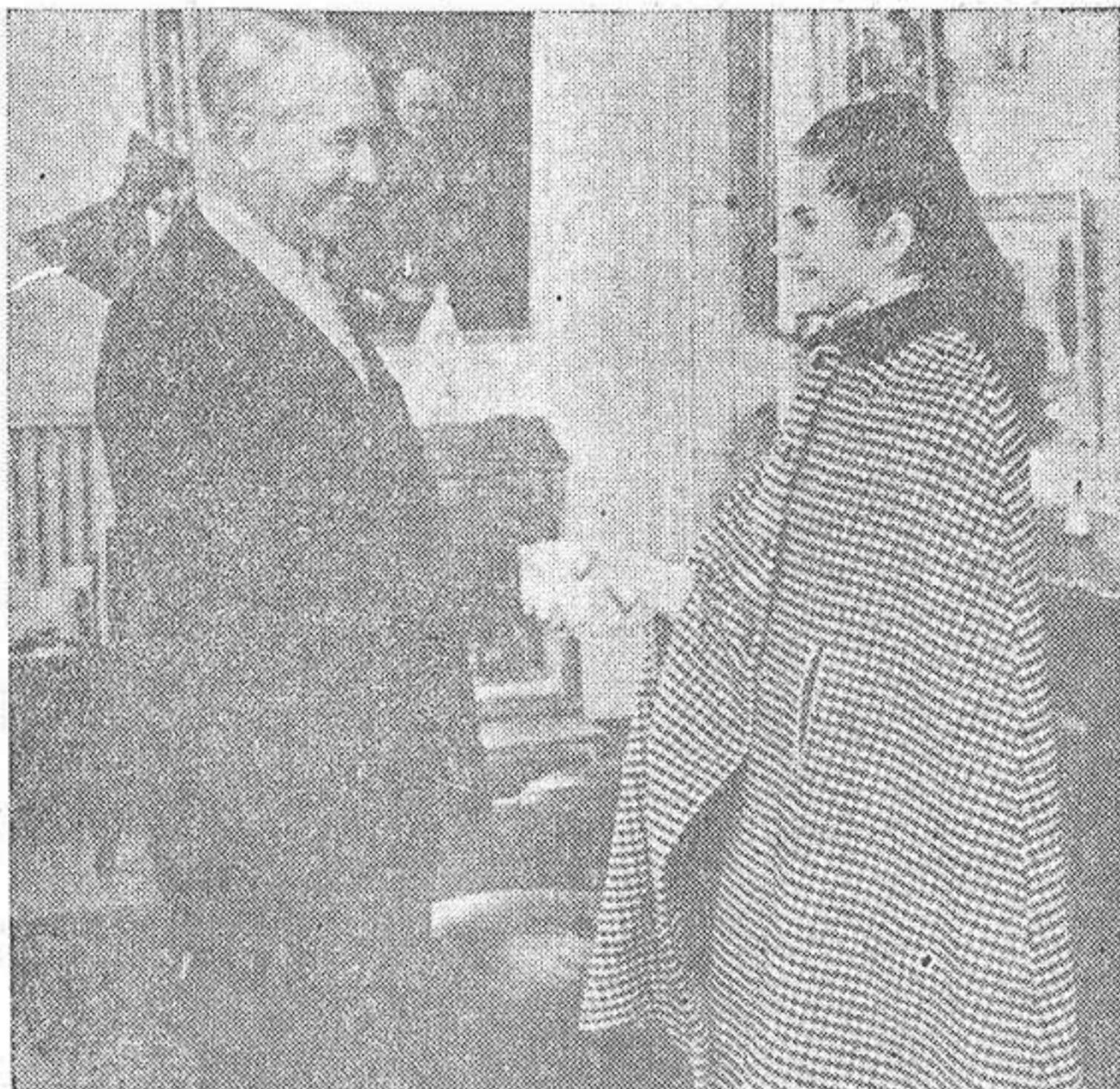
Minou Drouet, que en 1955 sorprendió al mundo con su precoz talento poético, se dedicó posteriormente a múltiples actividades. De repente ha decidido consagrarse al periodismo. Su primera entrevista la ha sostenido con Maurice Chevalier, uno de los hombres más famosos de Francia, y que en el grabado aparece despidiéndose de Minou. La jovencita Drouet titula su serie de entrevistas con el enunciado general de "Todo al desnudo". Ha declarado que pretende presentar a los personajes tal como son y no cual aparecen en público