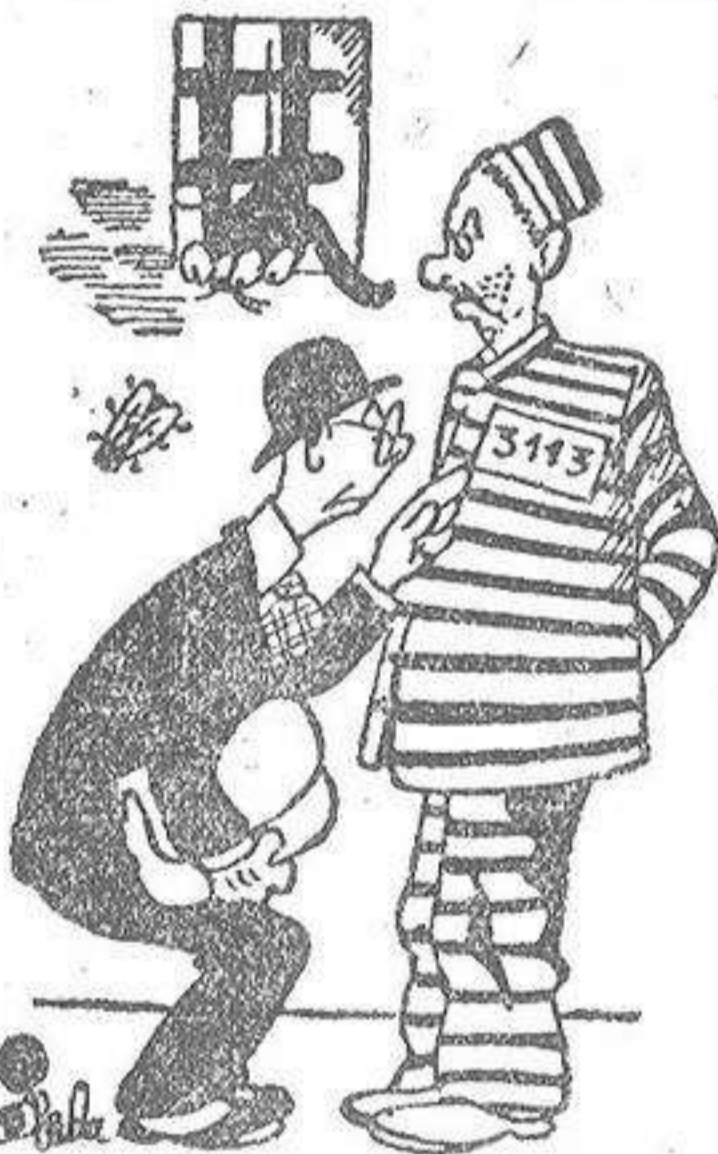
DON CASIMIRO, por Miranda — ¡Qué número más bonito! ¿Quieres usted darme una Participación de peseta?

Como en años anteriores, ha sido impresa la Memoria que la Secretaría de Organización y Estadística presenta a la Junta Interparroquial de Misiones en La Coruña. La parte literaria, los datos estadísticos, los gráficos, habían crecientemente de la gran labor realizada y de los óptimos frutos recogidos. Desde que se celebra el Domingo Misionero en La Coruña, todos los años fue incrementándose la colecta, hasta llegar en el actual a la cifra de más de 72.000 pesetas. Ello demuestra que la propaganda, tan inteligente como discreta, va calando en las conciencias de las gentes y, convenidas éstas de la obligación que tenemos los cristianos de ganar el mundo infiel para el reino de Cristo, colaboran con prodigalidad de oraciones y limosnas en la gran jornada misionera del penúltimo domingo de octubre. Nuestra enhorabuena a todos: a los organizadores y patrocinadores del DOMUND en la ciudad de La Coruña, como a los fieles que escuchan y atienden la voz de la Iglesia.