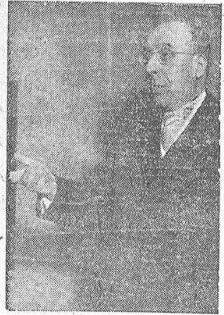
RAMON OTERO PEDRAYO

Gracias al eminente polígrafo y bono pensador gallego, Ramón Otero Pedrayo, se ha salvado, y se ha salvado bien, el bache abierto en el homenaje nacional tributado al P. Feijóo, homenaje limitado a la erección del monu-