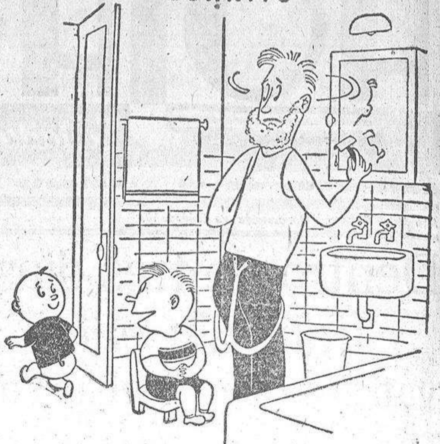
— Hermanito, puedes ir a jugar que cuando papá se corte, ya te avisaré para reírnos.