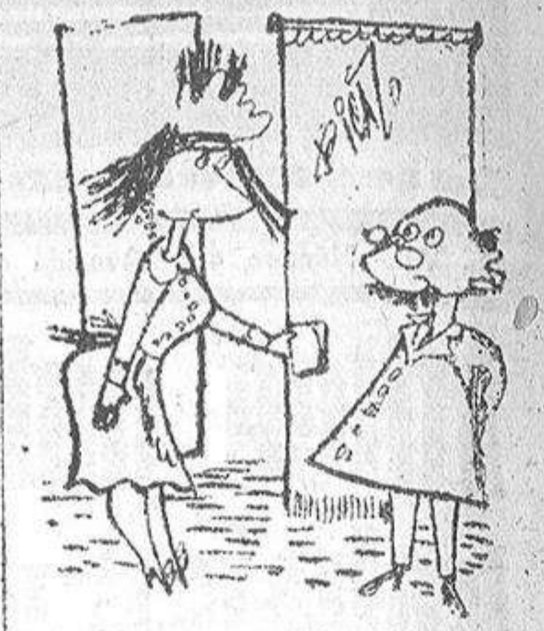
—Es la cuenta del oculista. —Pues no veo la manera de pagarla.