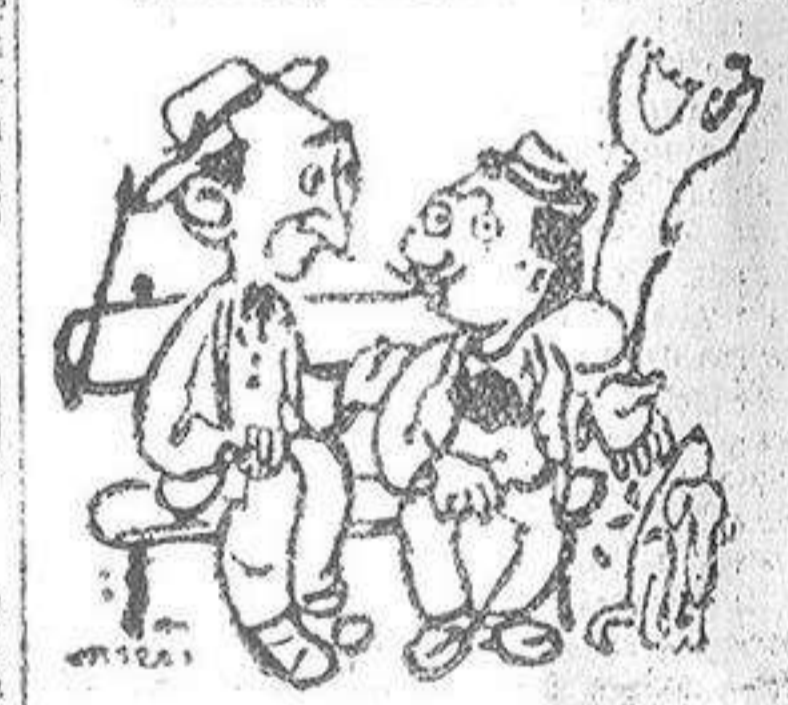
—Yo a mi perro le doy de comer radiografías. —¿Radiografías? —Sí; tienen muchos huesos.