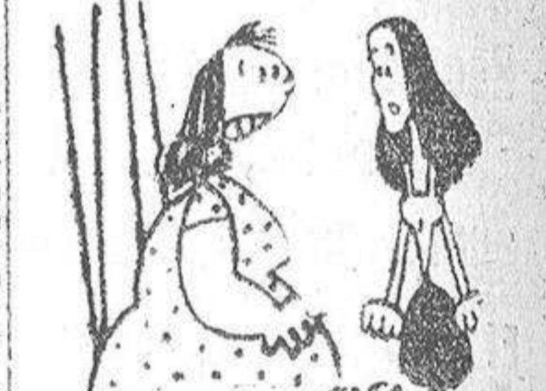
—Carmina: si ese joven que anda siempre contigo te pide la mano, ¿no que venga a hablar conmigo? —¿Y si no me la pide? —Entonces iré yo a hablar con él!