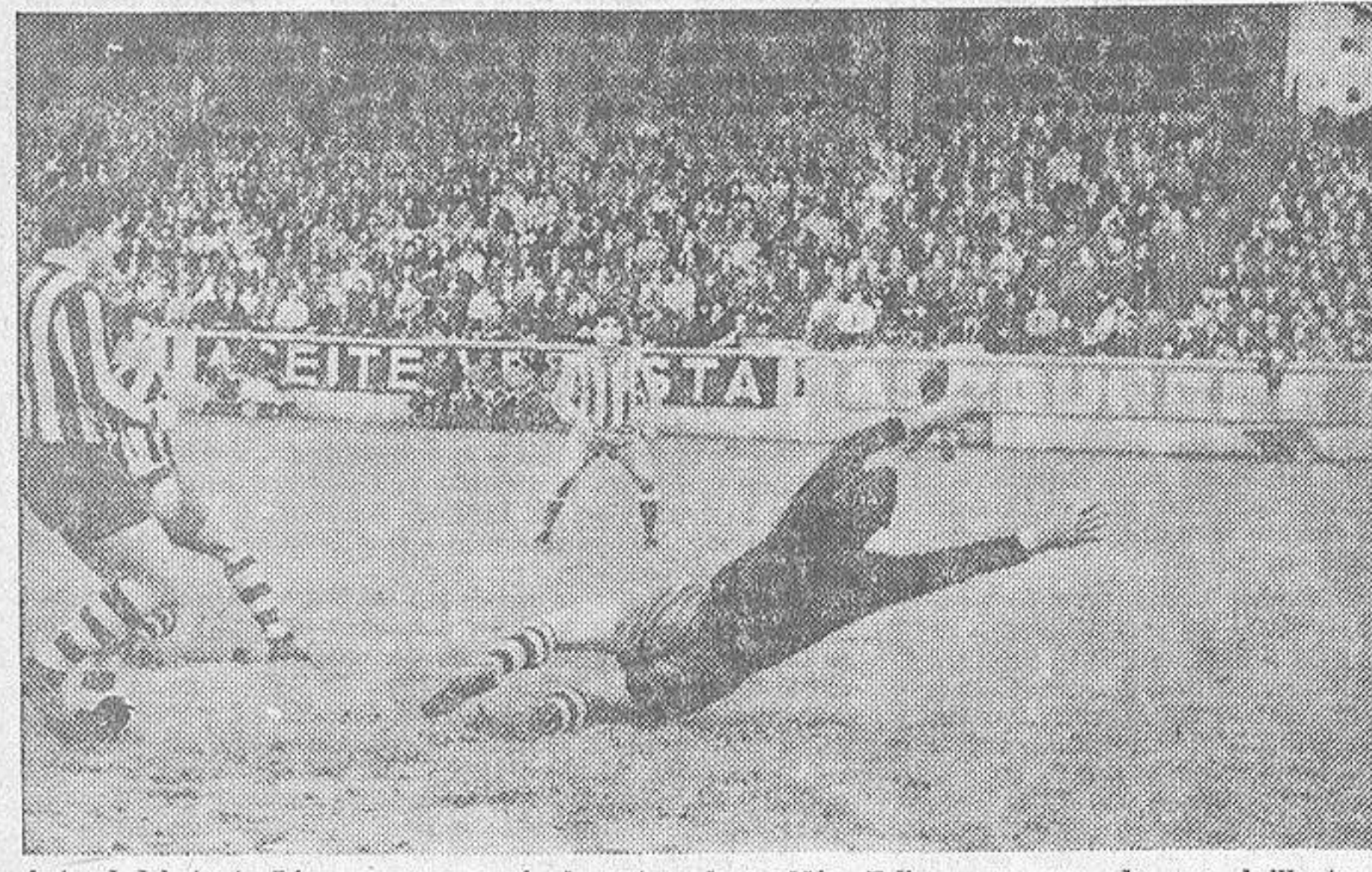
Ante el debutante López apareció aquí el portero baracaldés, Felipe, en una de sus brillantes intervenciones

El equipo vizcaino desplegó un fútbol alegre, sin preocupaciones excesivas