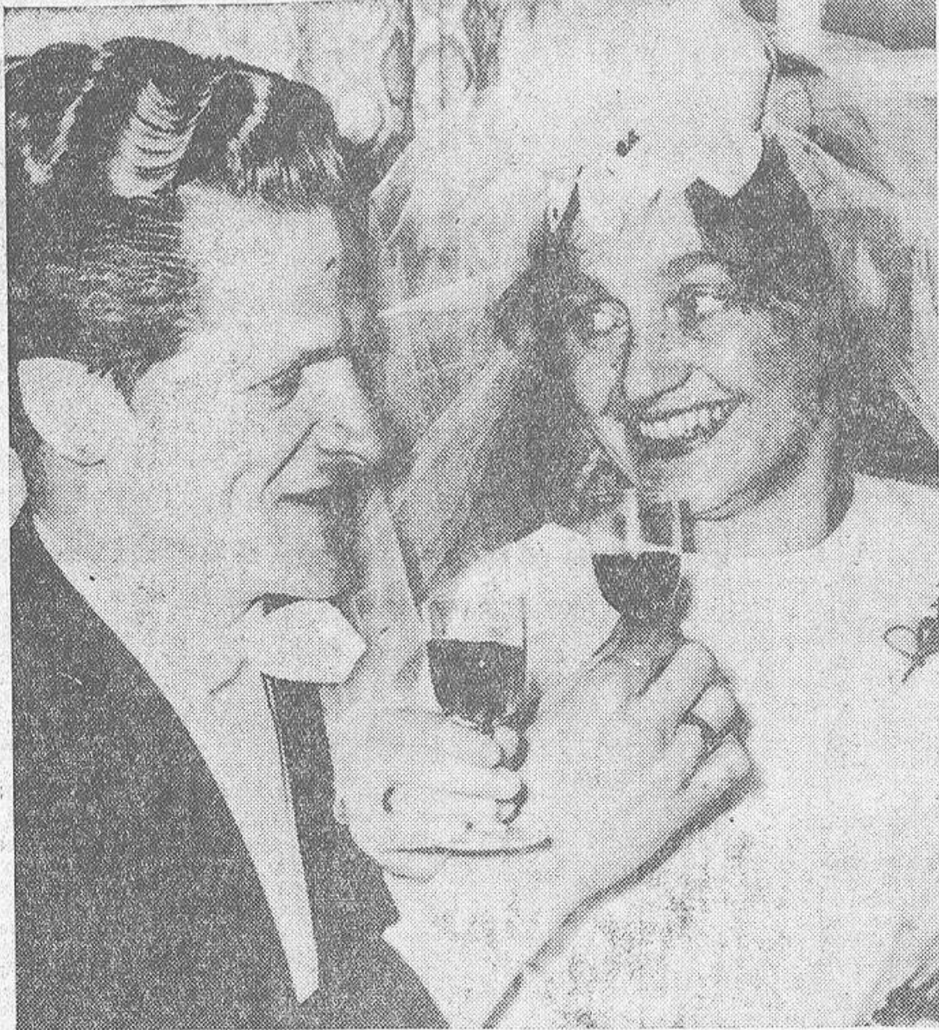
A estos recién casados se les puede considerar como un matrimonio de amor "maduro", que difiere del juvenil sentido de que los matrimonios jóvenes solo buscan la satisfacción en sus tendencias personales. El amor "maduro" busca la felicidad del cónyuge.

Después de haber discutido con sus consultantes en el aspecto psicológico del matrimonio, el doctor Stone aborda las realidades fundamentales del amor físico: