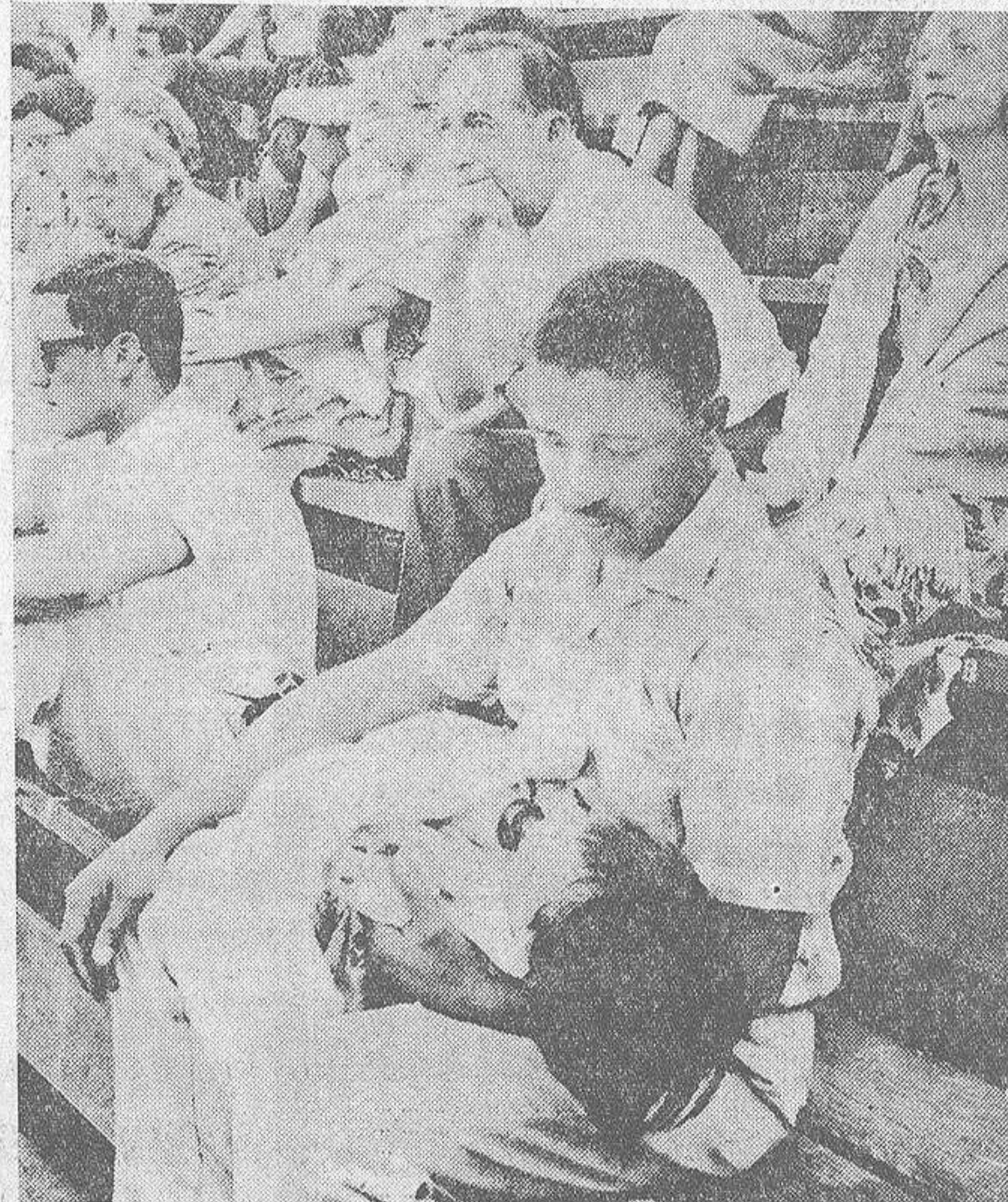
En las gradas de este estadio no existe la menor segregación. Al paso que un padre negro da el biberón a su hija, otros blancos no se pierden las menores incidencias del espectáculo musical que se les ofrece. La escena ha sido captada en la localidad californiana de Monterrey, donde se celebran con frecuencia conciertos de "jazz" como el mejor medio de vinculación

étnica. Intérpretes de las dos razas actúan ante un público compuesto también de negros y blancos. Escenas de verdadera solidaridad se registran no sólo entre los músicos y cantantes de las distintas agrupaciones, sino también entre el público. Es así como el "jazz" se ha convertido en un arma de integración racial.