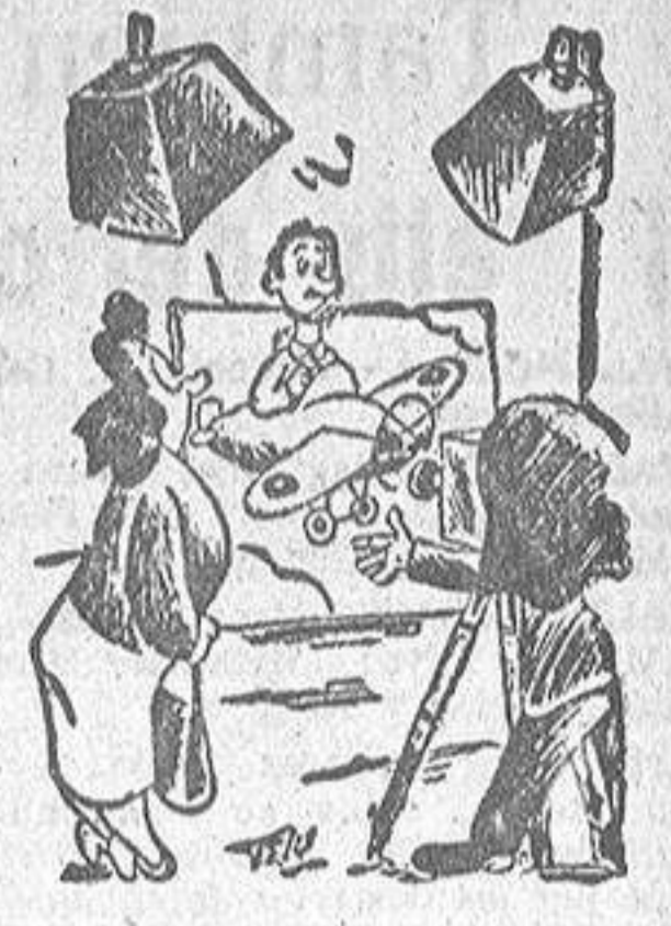
ESPOSA —¡Sé prudente, Pepe!

WASHINGTON, 4.—De fuente británica se informa que Gran Bretaña propone firmar un acuerdo aéreo con la Argentina, análogo al que este país firmó con los Estados Unidos. También se proponen los ingleses concertar otro convenio semejante con México. La Argentina tiene el proyecto de extender sus servicios aéreos por Suramérica en el próximo verano.—(EFE).