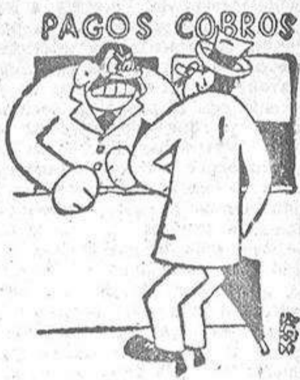
PAGOS COBROS EN EL BANCO —¡Buena, aquí no venga usted con imposiciones!