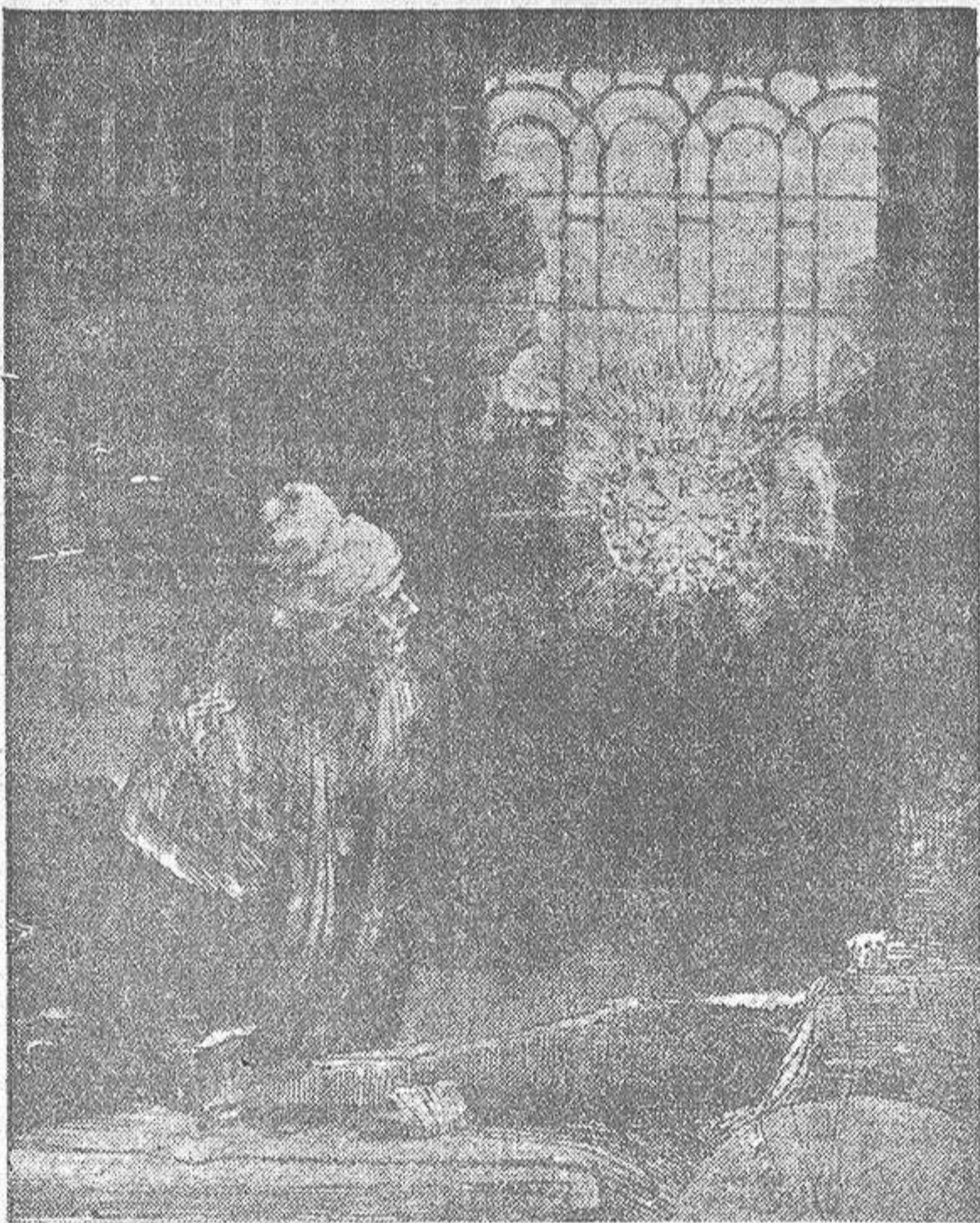
Primera versión gráfica de Fausto, según nos ofrece Rembrandt en este magnífico aguafuerte

Sobre la leyenda que sirvió de inspiración a Goethe para componer el "Fausto" se han dado numerosas versiones y se ha discutido ampliamente. ¿Conocía el poeta de Weimar "El mágico prodigioso" de nuestro Calderón? Aunque en la obra calderoniana, Justina, como creación del espíritu católico del libre albedrío lucha contra el mal y vence, mientras que Margarita sucumbe, porque le ha sido aplicado el criterio de la predestinación, símbolo del protestantismo, existen indudables analogías entre una y otra producción. También se han señalado como precursores de Goethe a Marlowe e incluso a Shakespeare, pero uno de los orígenes más curiosos de la leyenda de Fausto es la que se refiere al doctor de este nombre, auxiliar de Gutenberg.