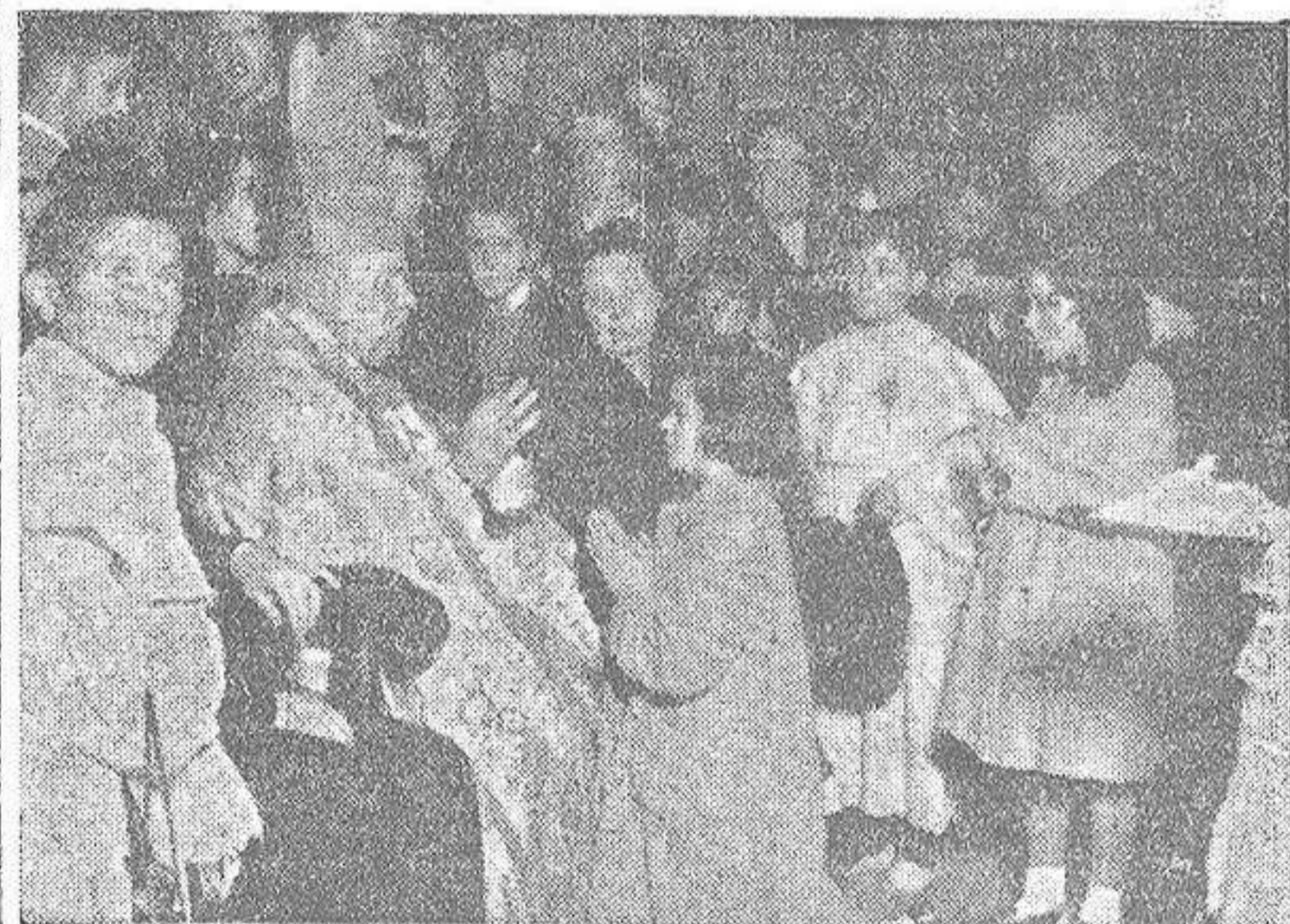
Estos días, las parroquias, congregaciones religiosas y centros docentes, están recibiendo la visita del Sr. Obispo Auxiliar de Santiago, quien lleva administrado el Sacramento de la Confirmación a millares de niños coruñeses. La HOJA DEL LUNES, de La Coruña, editada por la Asociación de la Prensa, saluda respetuosamente al Ilustre Prelado, y hace los más fervientes votos porque su estancia en nuestra ciudad rinda los mayores frutos espirituales.