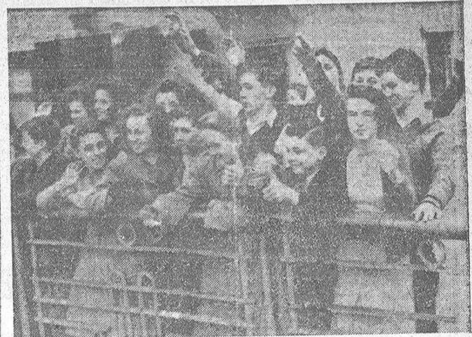
Los niños ingleses que fueron evacuados a Australia en 1940 regresan ahora a su patria. Los muchachos repatriados esperando el momento de desembarcar en Southampton