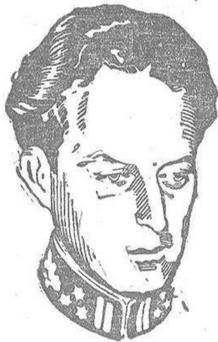
LEOPOLDO III DE BELGICA

Atravesaron las calles de Londres en un coche de caballos escoltado por oficiales de la Casa Real.