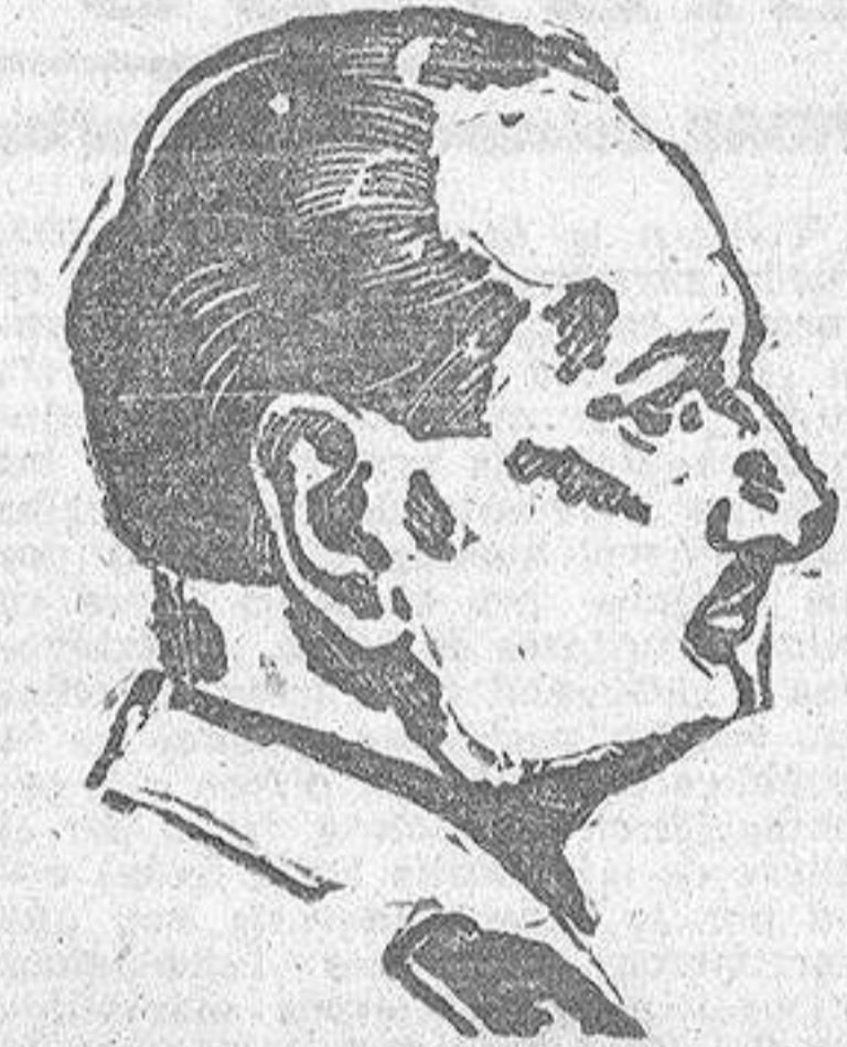
José Luis de Arrese, Ministro Secretario General del Movimiento

ANTE LA CRUZ DE LOS CAIDOS A las 11,30 el camarada Arrese, con las demás personalidades y jerarquías se trasladó a la Cruz de los Caídos. En la explanada de la Alcázar, frente a