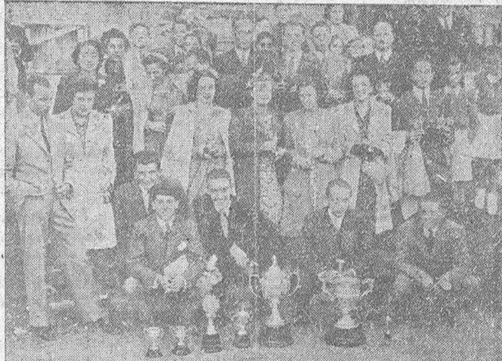
Los tenistas que obtuvieron premios en las diversas pruebas disputadas durante la temporada actual

El partido ha sido muy interesante y a ratos se ha jugado un fútbol de gran calidad. El Atlético ha demostrado ser el gran equipo de la temporada pasada, dando una magnífica expresión especialmente por lo que se refiere al extraordinario jugador Panizo. El Zaragoza probaba varios jugadores, entre ellos Mucala y Martínez, que por su juego han complacido a la afición aragonesa.—(ALFIL).