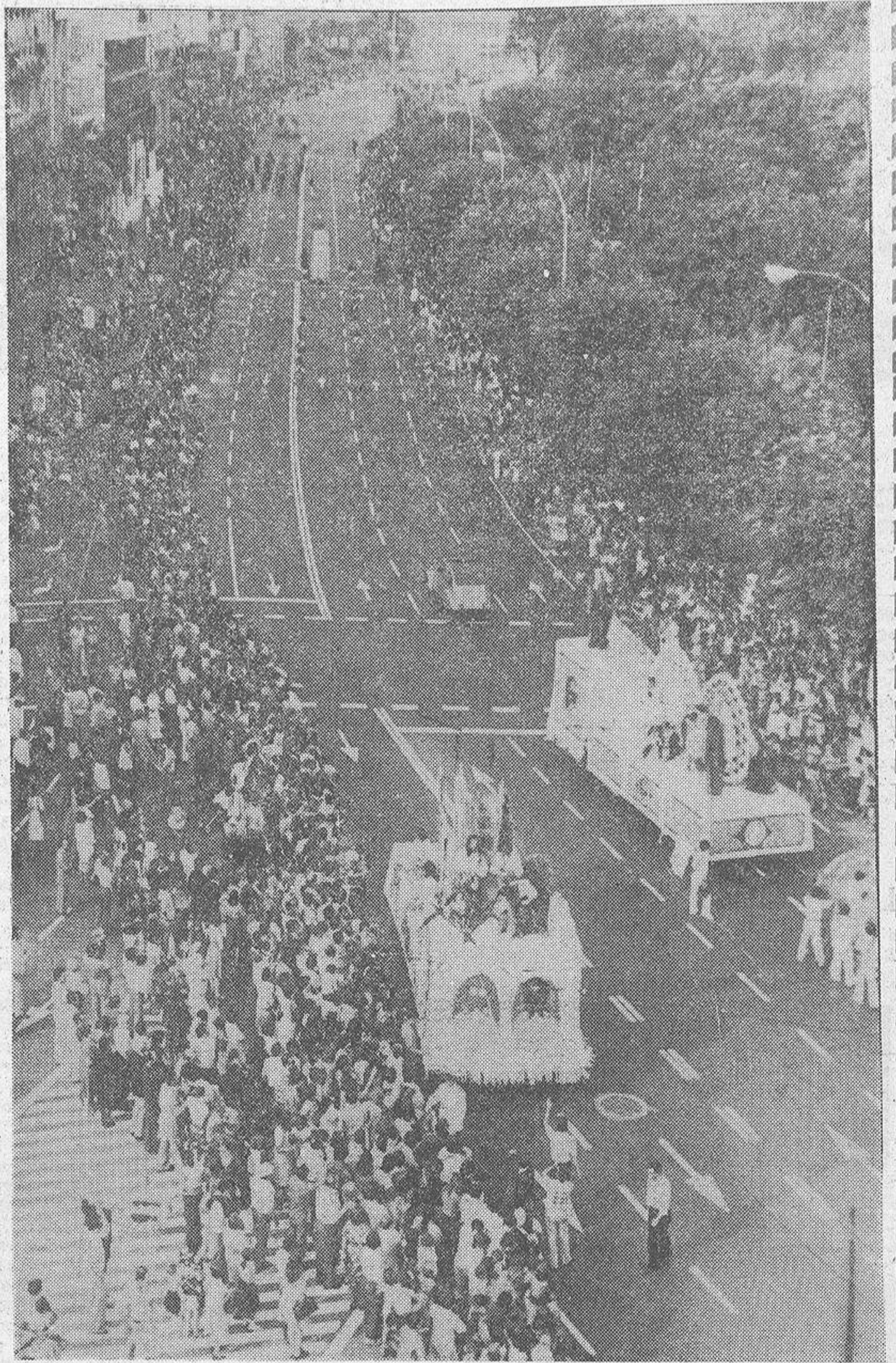
Se celebró ayer en La Coruña el anunciado desfile de carrozas, en el que participaron las presentadas por siete sociedades de recreo coruñesas y el Ayuntamiento. Esta última iba ocupada por la reina de las Fiestas y sus damas de honor. Millares de coruñesas y forasteros presenciaron el desfile, en el que también tomaron parte las "majorettes" de Mont Marsan. En la foto, aspecto que ofrecían los Cantones durante la cabalgata.