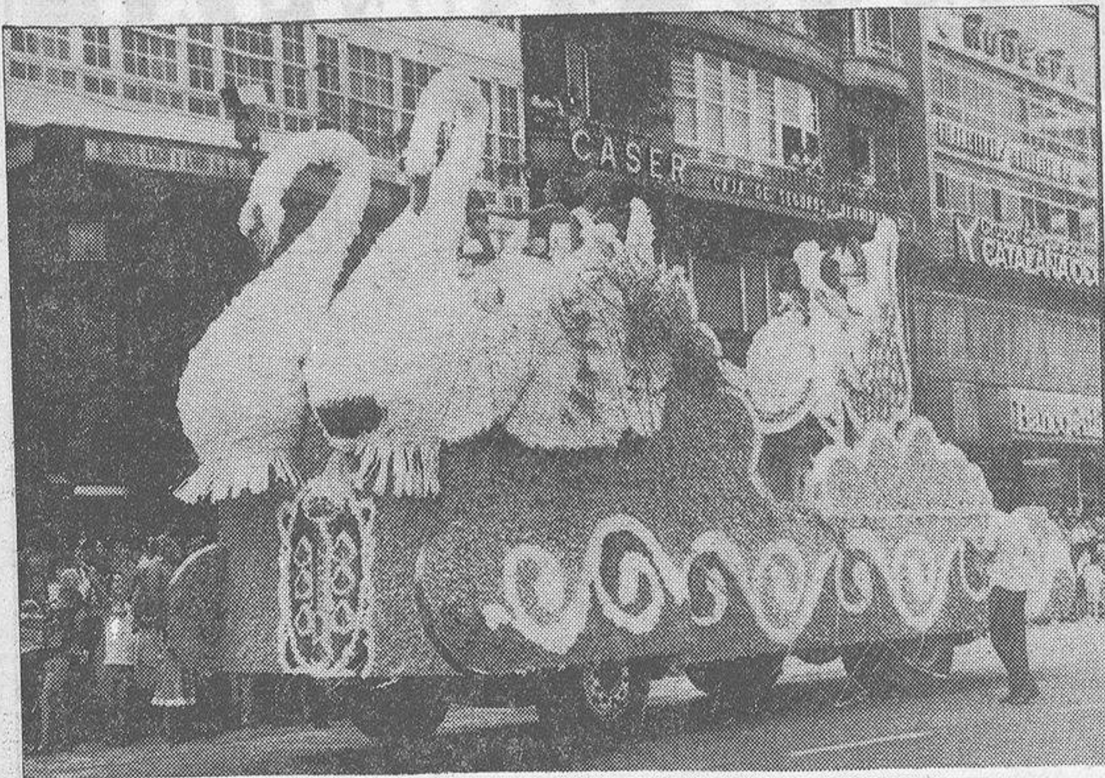
He aquí la carroza presentada por el Ayuntamiento, ocupada por la Reina de las Fiestas y sus damas de honor.

Millares de coruñeses y forasteros presenciaron ayer domingo la anunciada "batalla de flores" —que por la total ausencia de flores debiera denominarse más bien "Desfile o Festival de Carrozas"— celebrada a lo largo de la Marina y los Cantones, con participación de ocho carrozas ocupadas por bellas y jóvenes coruñesas pertenecientes al Casino, Club de Golf, Tenis, Club del Mar, Náutico, Hípica y Aeroclub. La carroza presentada por el Ayuntamiento iba ocupada por la Reina de las Fiestas y sus damas de honor.