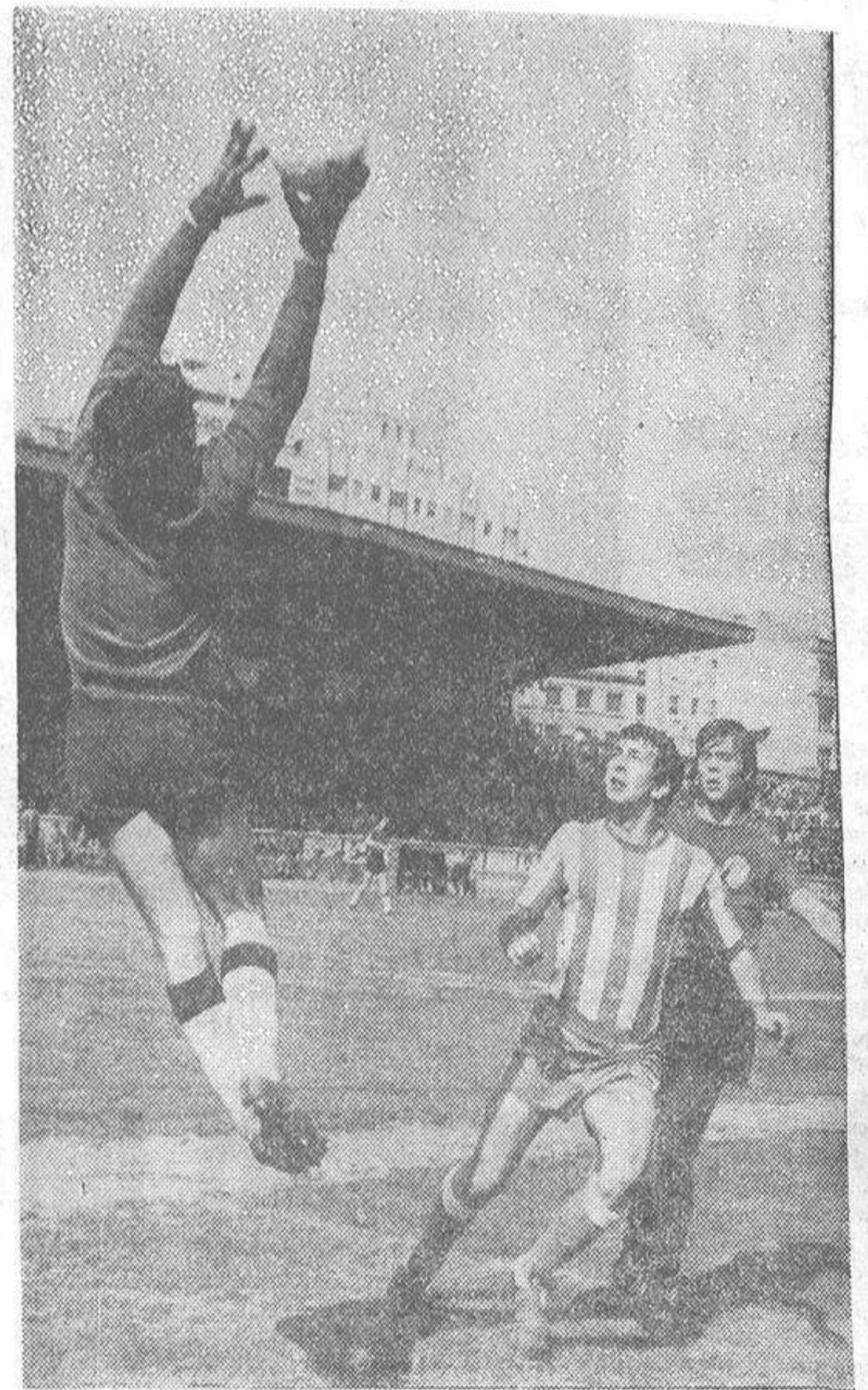
El guardameta del Castellón se hace con el balón en oportuna salida, ante la situación expectante de un defensa de su equipo y un delantero contrario.