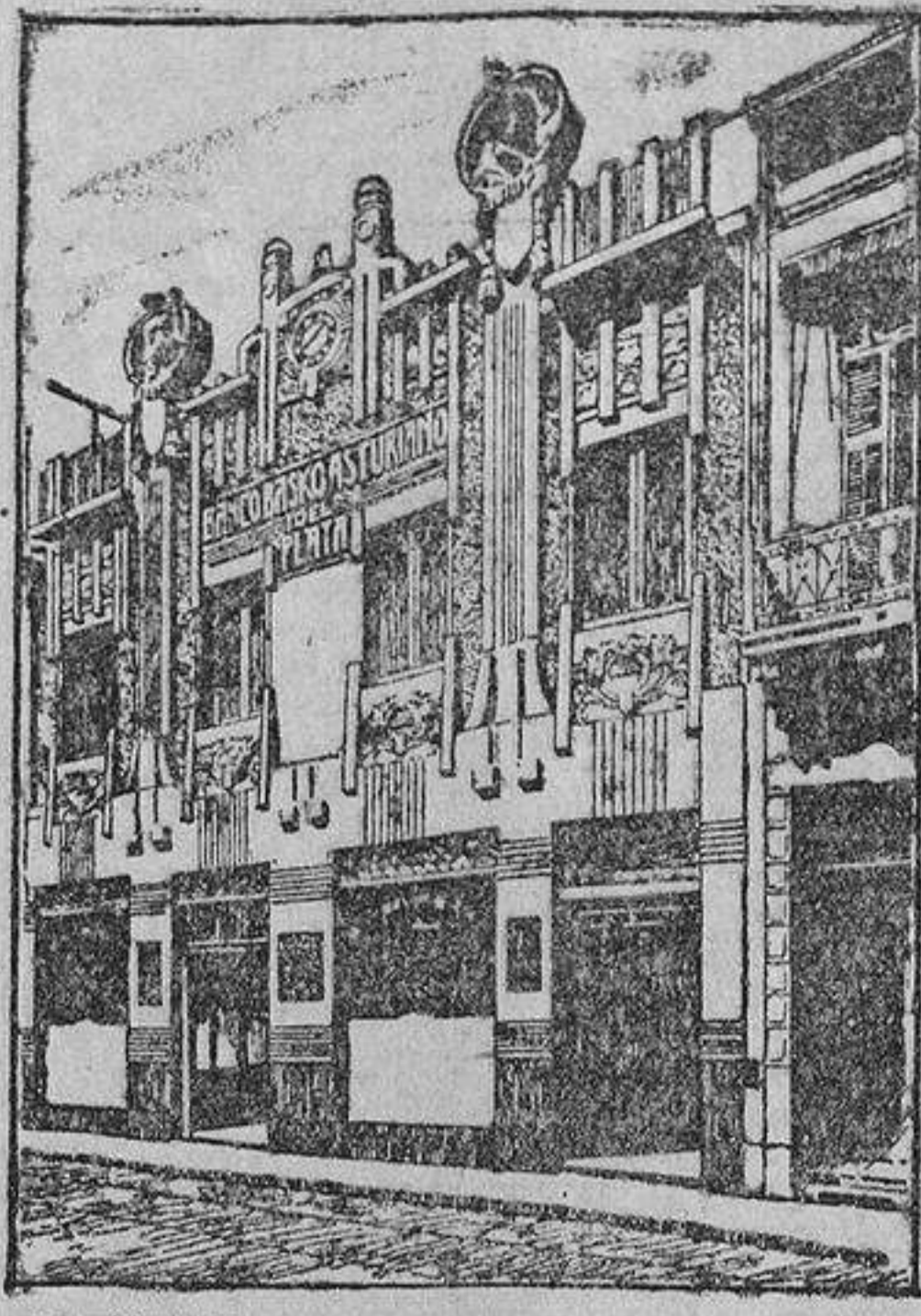
EDIFICIO DEL BANCO

BUENOS AIRES.—Calle Maipú, 73 al 87. Casilla de Correos, 619