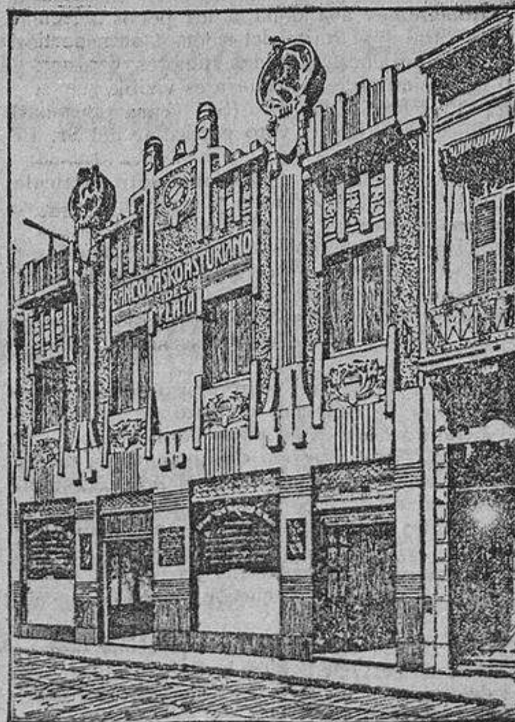
EDIFICIO DEL BANCO

BUENOS AIRES.—Calle Maipú, 73 al 87. Casilla de Correos, 619