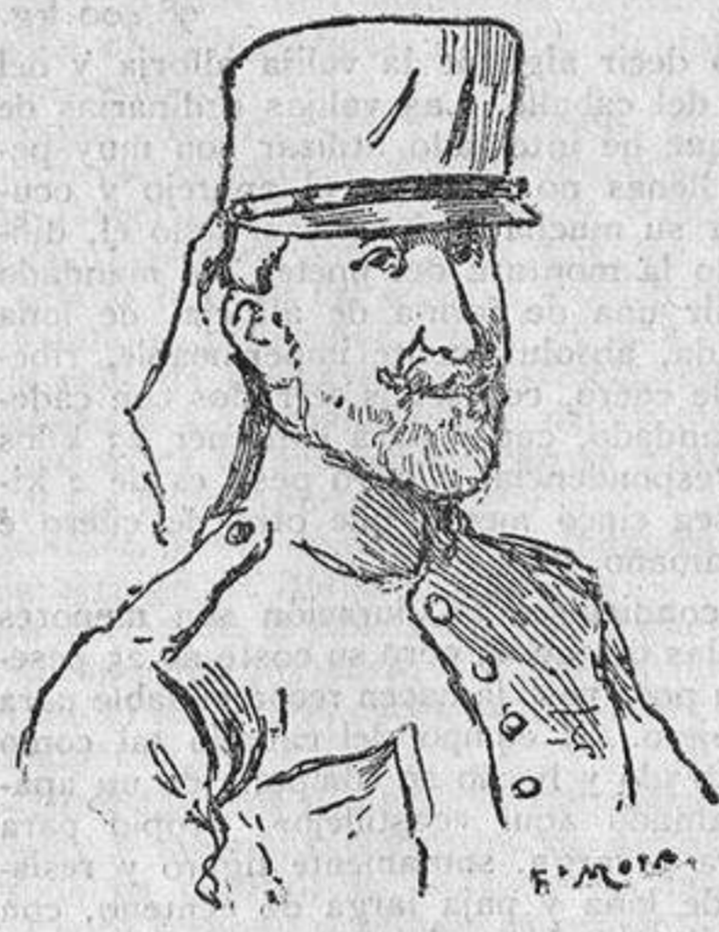
GENERAL D. MIGUEL DE IMAZ

El duelo ha sido presidido por el general Tovar, a quien acompañaban sus ayudantes. Y el cortejo lo han formado muchos jefes y oficiales de todas las armas y cuerpos del Ejército.