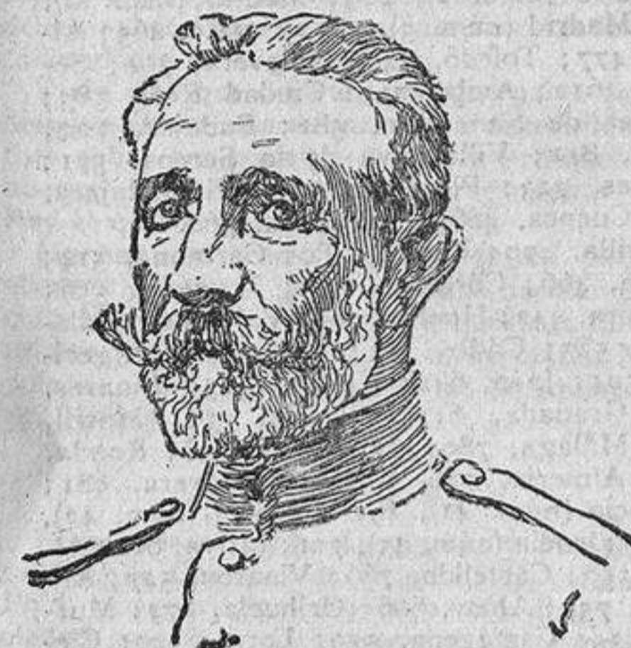
EL GENERAL ALFAU del ejército de operaciones.

campamento, para reconocer el terreno, algunas parejas de Caballería.