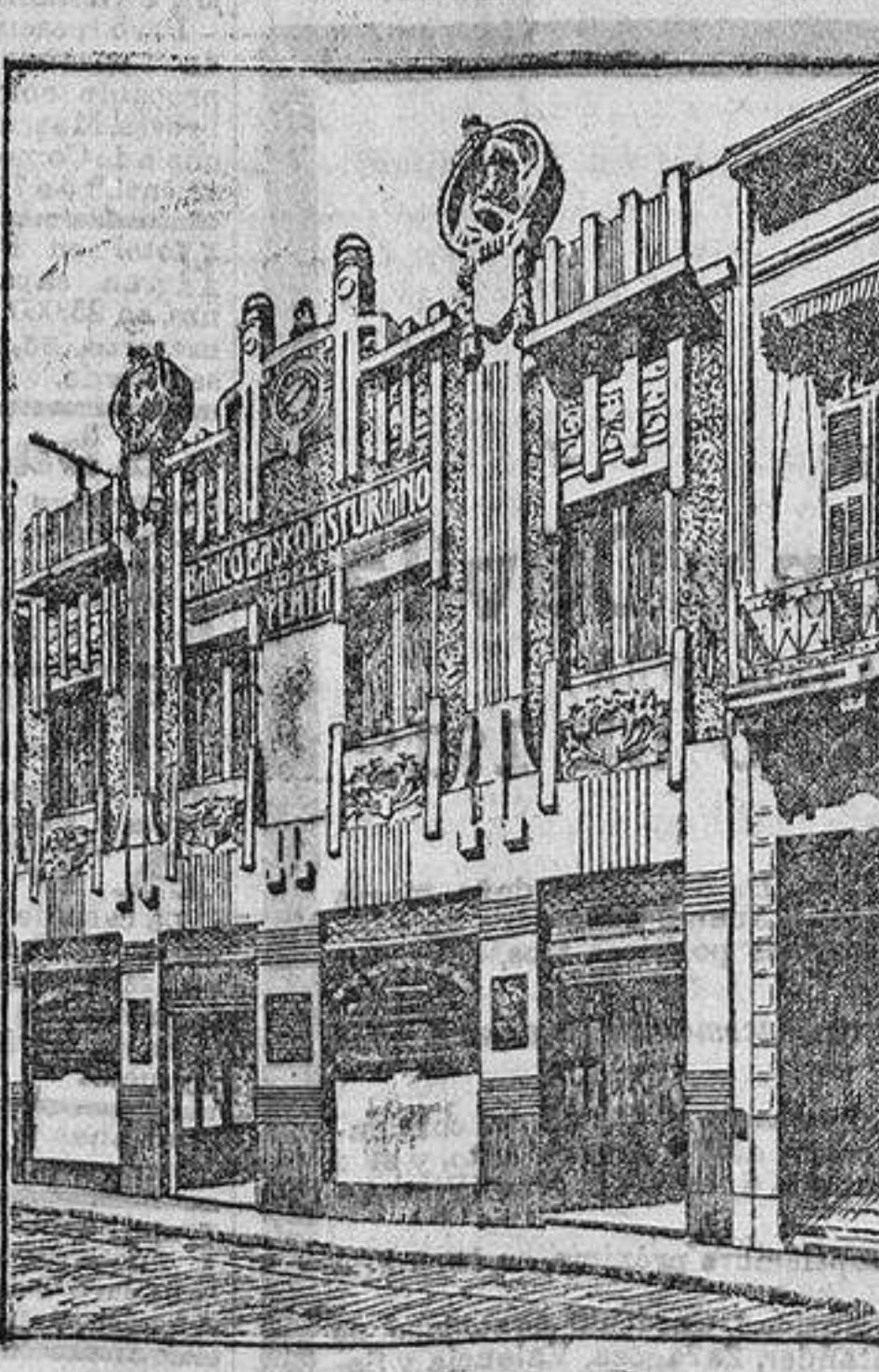
EDIFICIO DEL BANCO