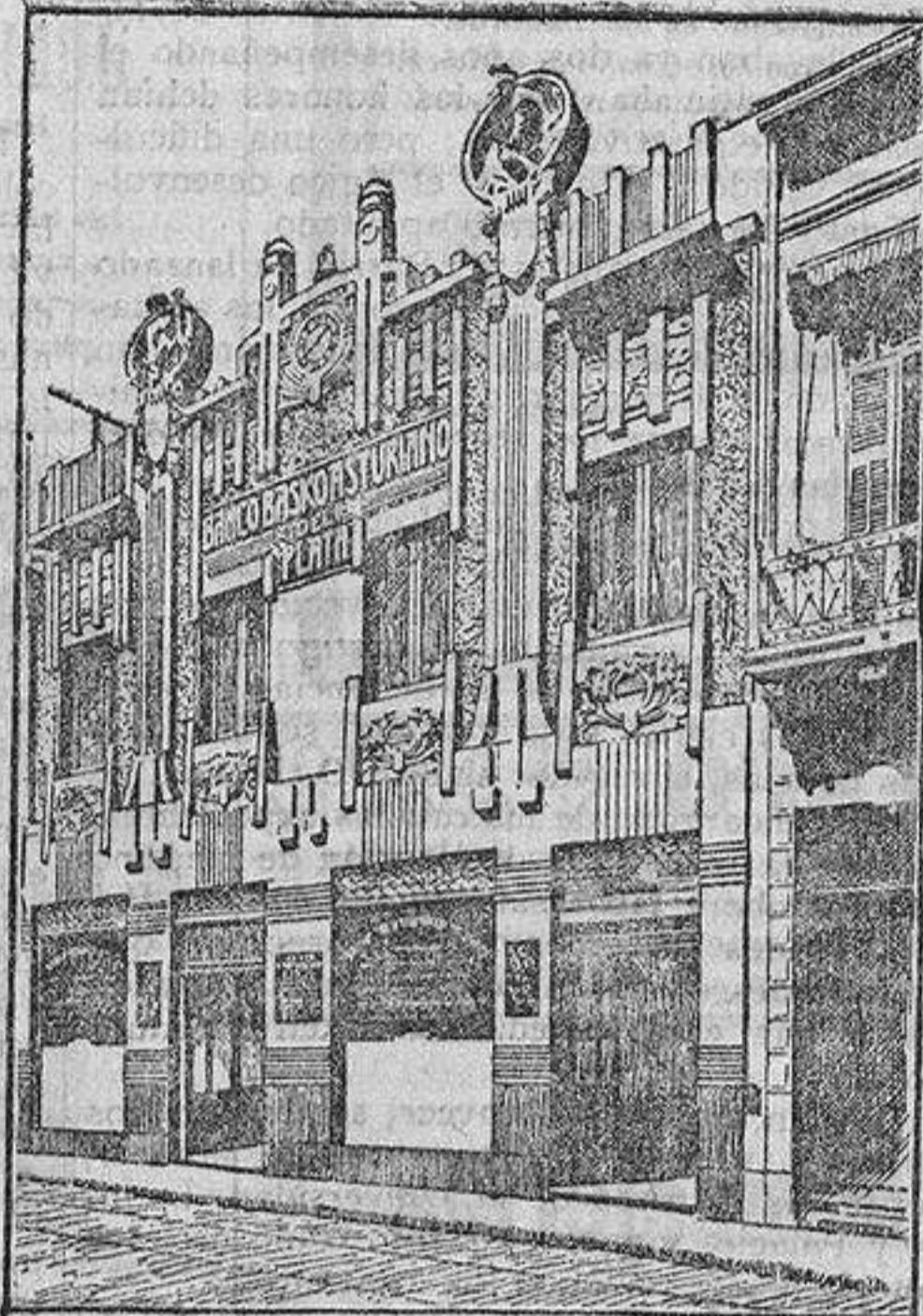
EDIFICIO DEL BANCO

Empresa Bancaria y Mercantil de intercambio con España