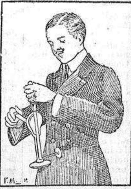
Las vibraciones del VEEDEE vigorizan enérgicamente el estómago.

Buena Salud y El Buen Semblante (que gratuitamente entregamos á la persona que lo solicita), la lista de las múltiples aplicaciones á que se presta el VEEDEE en toda casa de familia, para experimentar al pronto una sensación de asombro, sensación que bien puede degenerar en otra de incredulidad, motivada sin duda alguna por la multitud de abusos que en Madrid han cometido diferentes ESPECULADORES sugestionando nuestro público con anuncios llamativos, propagando aparatos y específicos, sin otro resultado positivo que el lucro comercial. Efectivamente; estamos tan cansados del charlatanismo y tan acostumbrados á leer esos prospectos de productos MARAVILLOSOS, ofrecidos como CURALO-TODO, que, en realidad, sentimos tentaciones de sonreír cada vez que se nos habla de alguna PANACEA UNIVERSAL, susceptible de realizar toda clase de prodigios curativos, SIN OTRA GARANTIA QUE LA SUGESTION DE LOS ANUNCIOS.