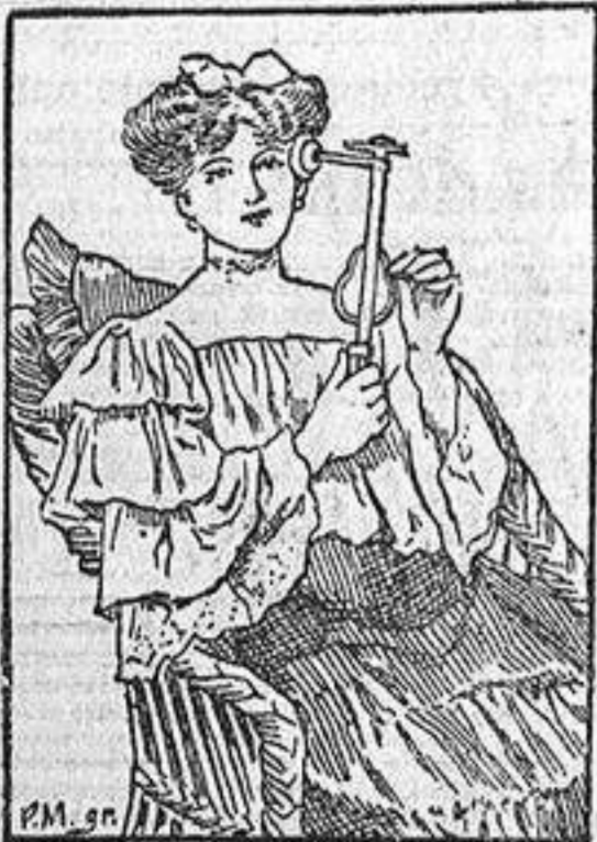
El VEEDEE cura estas enfermedades en poco tiempo.