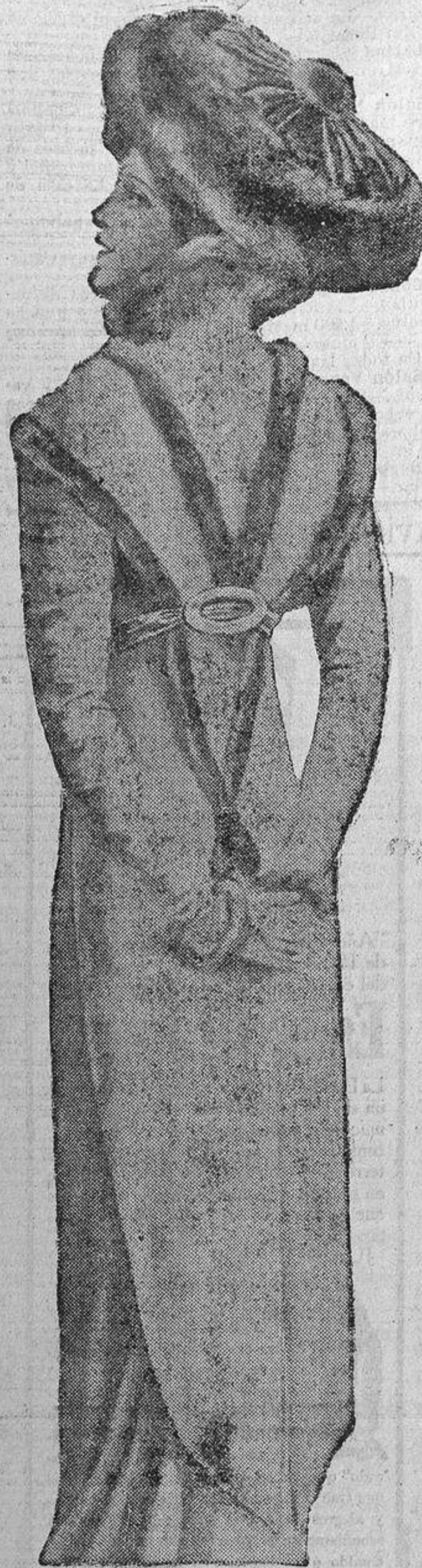
VESTIDOS DE CALLE

La última creación: chaquet-librea adornado con pieles de emarta.—La falda guarnecida de lo mismo.—Gorra á la cosaca, de marfil y raso. PELETERIA LAZARO. Casa de confianza. 6, ESPARTEROS, 4. Catálogos gratis.