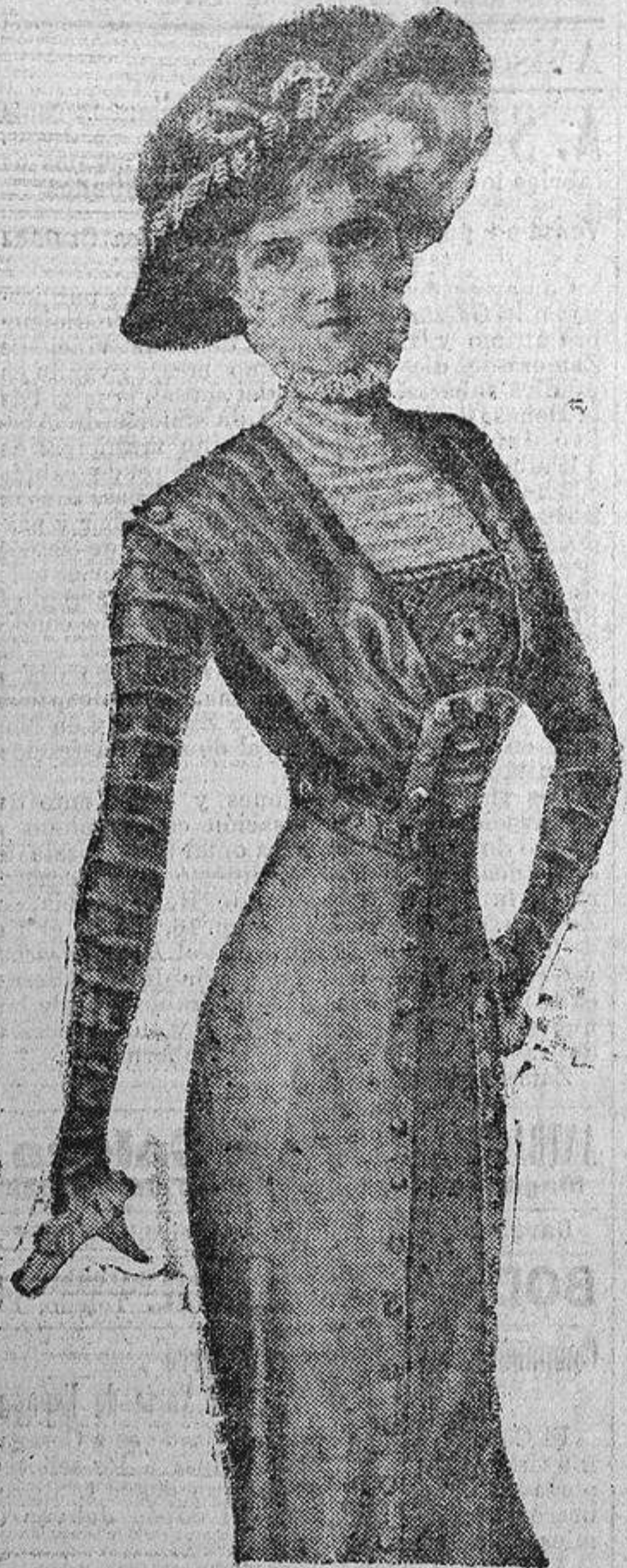
VESTIDOS DE PASEO Y VISITA

Ultimo modelo.—Continúa imperando la moda con tendencias Directorio, pero sin exageraciones.