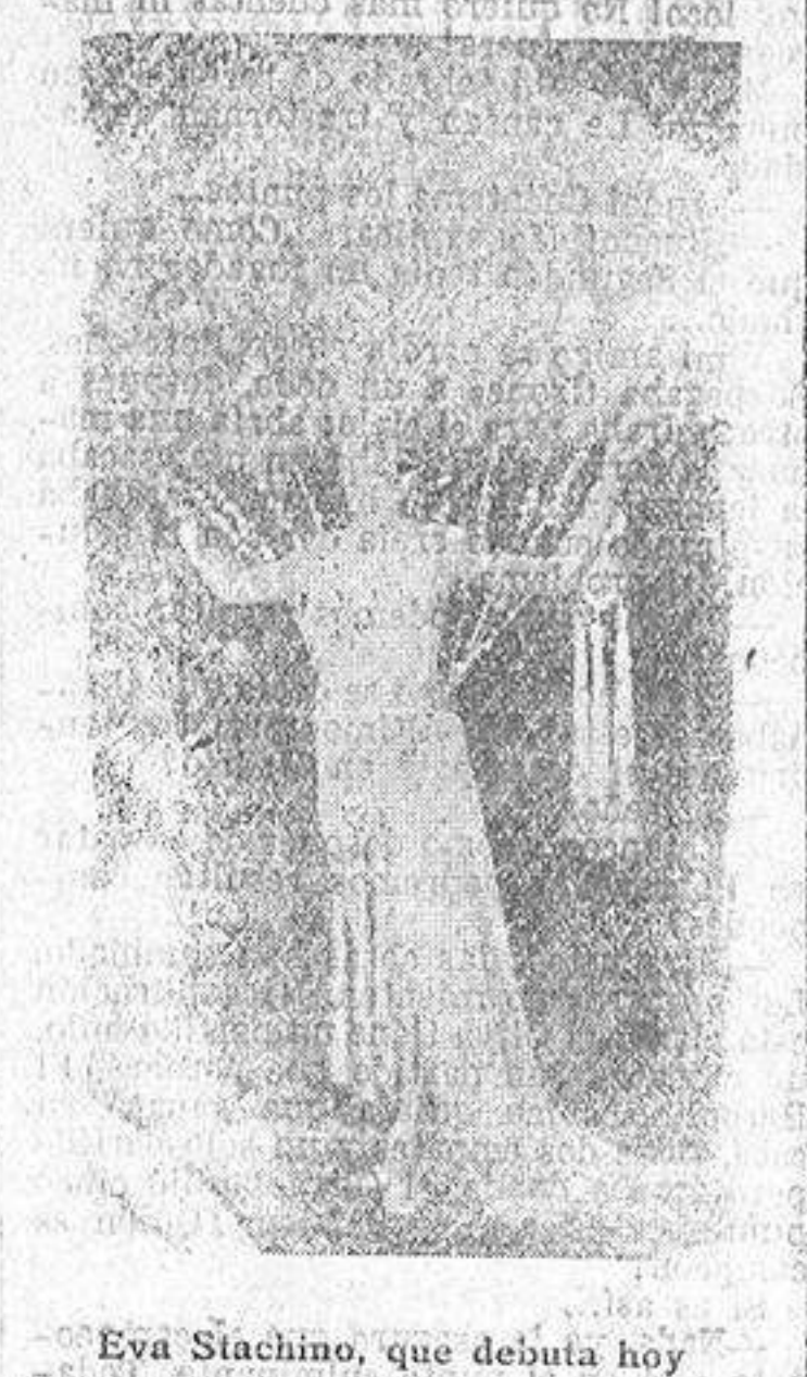
Eva Stachino, que debuta hoy

EL TIEMPO Hizo ayer un día excelente: el barómetro se movió entre los 764,6 milímetros y los 768; el termómetro marcó una máxima de 12,7 grados por una mínima de 4; no sopló el viento y el cielo se mantuvo casi despejado. El Observatorio dice que no es de esperar cambio importante del tiempo.