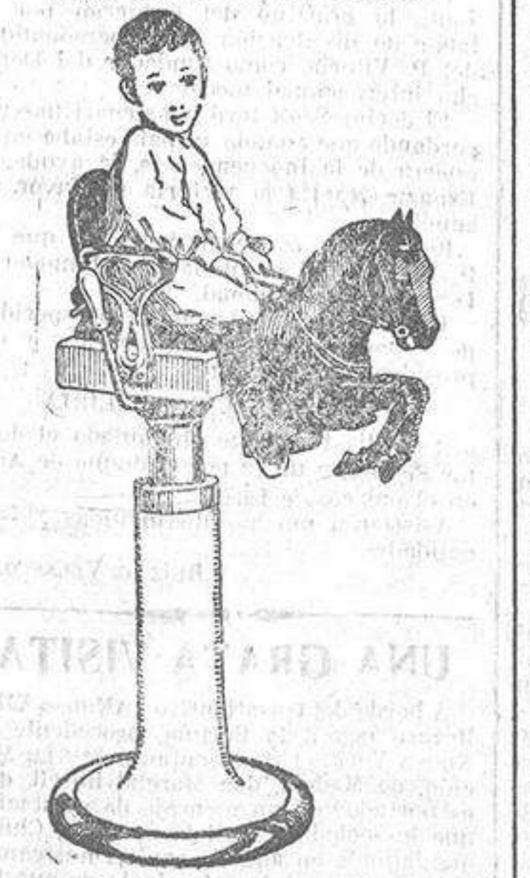
ACTIVIDAD EN EL AU PETIT SALÓN

Entraron los vapores "Orcoma", procedente de la Habana: "Sierra Ventana", de Bremen, con pasaje; "Santamaña", de Barcelona y Villagarcía, con carga general; "Galicia", de San Sebastián, con cemento, y el balandro "Tedín", de Bilbao, con cemento. Fueron despachados los vapores "Orcoma", para Santander; "Sierra Ventana", para Buenos Aires, con pasaje; "Santamaña", para Gijón, Santander, Palencia y Bilbao, con carga general, y "Galicia", para Marín, con cemento. EL "ORCOMA" Ayer, en las primeras horas de la mañana, llegó el vapor inglés "Orcoma" de la Compañía del Pacífico, de retorno de Liverpool, con pasaje; "Sierra Ventana", de Liverpool, con pasaje; "Santamaña", de Barcelona y Villagarcía, con carga general; "Galicia", de San Sebastián, con cemento, y el balandro "Tedín", de Bilbao, con cemento. Procedente de Bremen entró ayer en nuestro puerto a la una y cuarto de la tarde, el vapor "Sierra Ventana" del Lloyd Norte Alemán. Conducía en tránsito 396 pasajeros y aquí embarcaron 160 más. El barco salió a las seis de la tarde para Villagarcía y Bueos Aires.