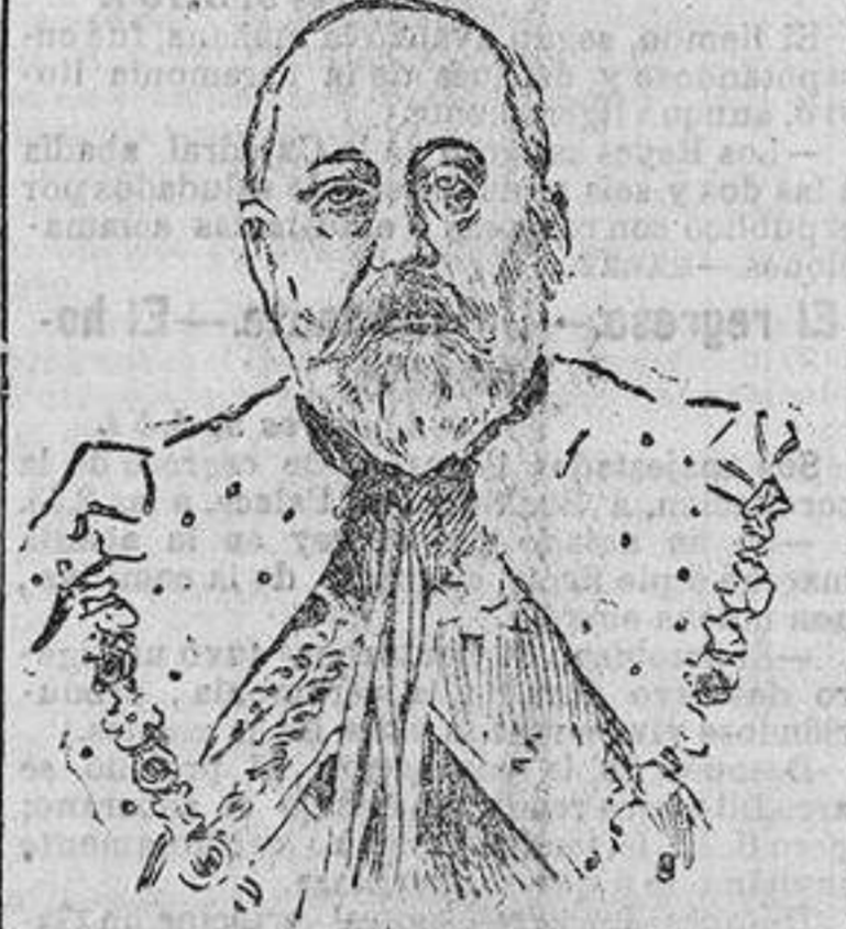
S. M. el Rey.

La policía, que tantos descontentos ha hecho en la población londinense por sus severas medidas de orden para la coronación, y sobre todo por las famosas barreras que aislaron por completo el trayecto, ida y vuelta, de Buckingham Palace a Westminster's Ab