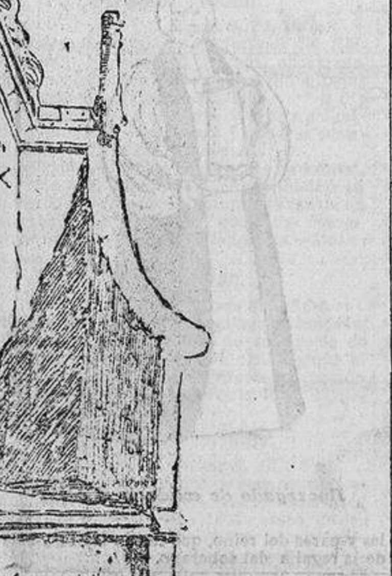
S. M. la Reina.