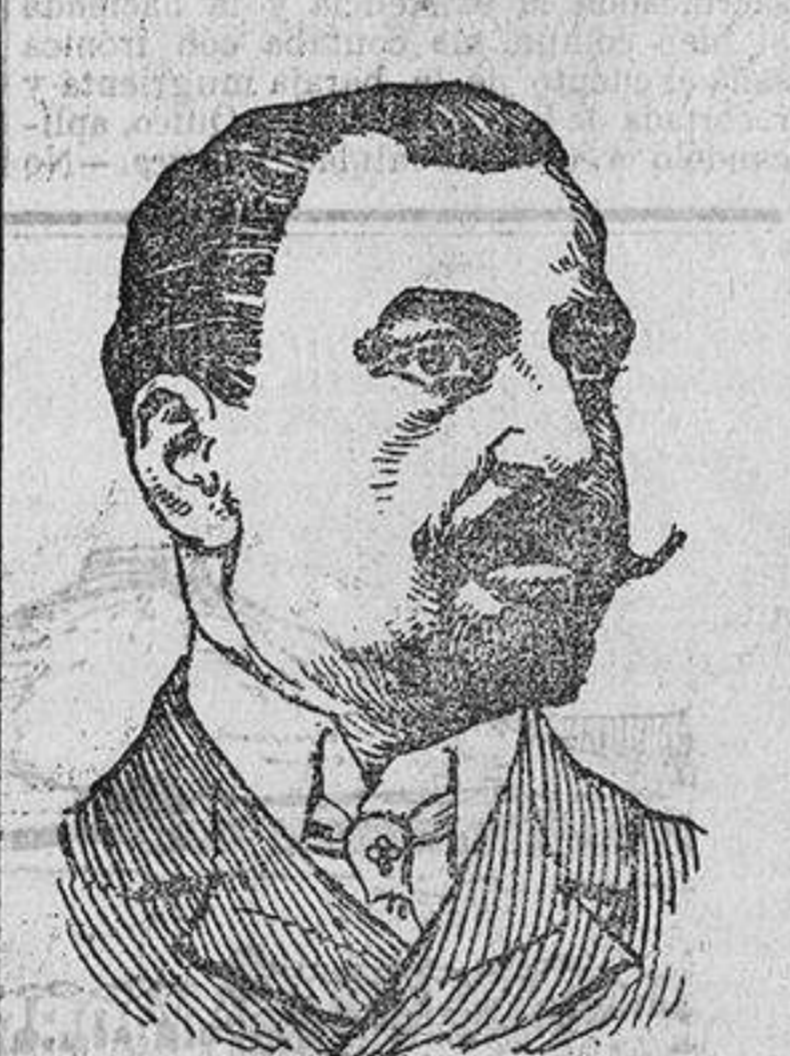
DON JENARO COLOMBRES Alcalde de Palencia.