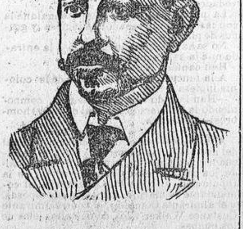
DON VALENTIN CALDERON Presidente de la Diputación provincial de Palencia.

El Monarca recibe muchos regalos. Se ha celebrado el banquete organizado por el Ayuntamiento en obsequio a los concejales madrileños.