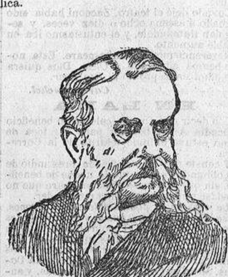
El marqués de la Vega de Armiño. Don Antonio Aguilar y Correa, marqués de la Vega de Armiño, conde de la Bobadilla, vizconde del Pegullal, ex presidente del Congreso, ex ministro de Estado, Gobernación y Fomento; director de la Academia de la Historia; presidente de la de Ciencias Morales y Políticas; maestrante de Sevilla, gran cruz de diferentes órdenes nacionales y extranjeras.