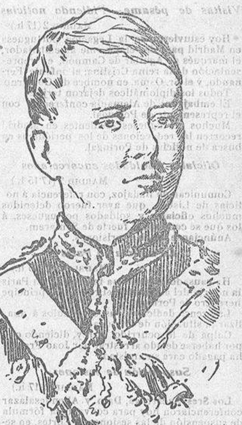
El príncipe heredero

Los asesinos eran seis hombres armados de carabinas y revólvers. Consta que los autores estaban pagados por los agitadores políticos, enemigos del Gobierno. Entre los muertos por la policía, y por el ayudante del Rey D. Carlos señor Figueira, figura un francés, jefe del grupo, sobre cuyo cadáver, al ser registrado, se halló un cinto lleno de dinero, precio del asesinato.