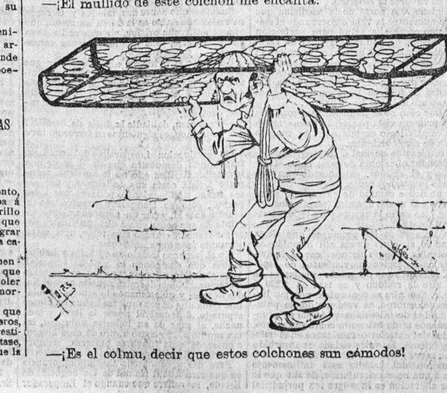
—Es el colmu, decir que estos colchones son cómodos!