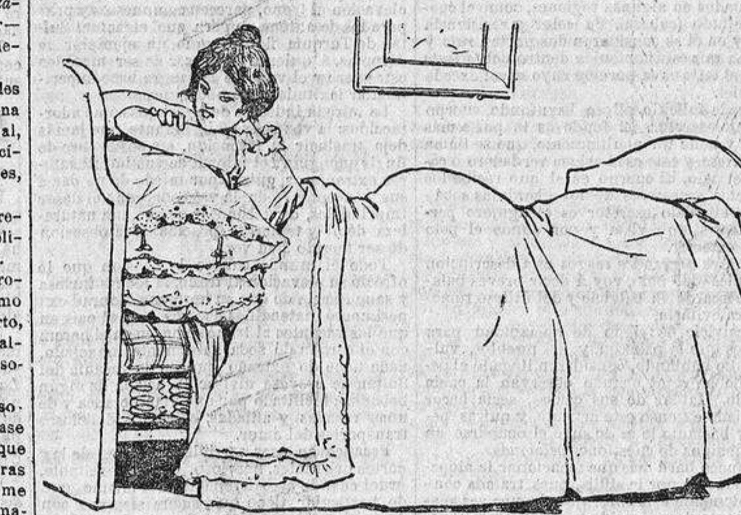
—El ruido de este colchón me encanta!