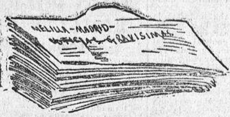
Telegrama que envía el corresponsal

PARAGUAS abanicos y entont-eas. PARAGUAS nadie compra sin ver los de casa M. de Diego, P. del Sol, 13. ESPECTACULOS PARA EL DIA 13