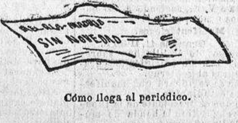
Cómo llega al periódico.