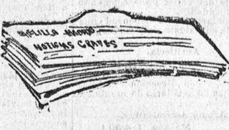
Cómo sale del gobierno militar de Melilla.