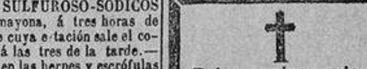
SOLUCION AL ANTERIOR.