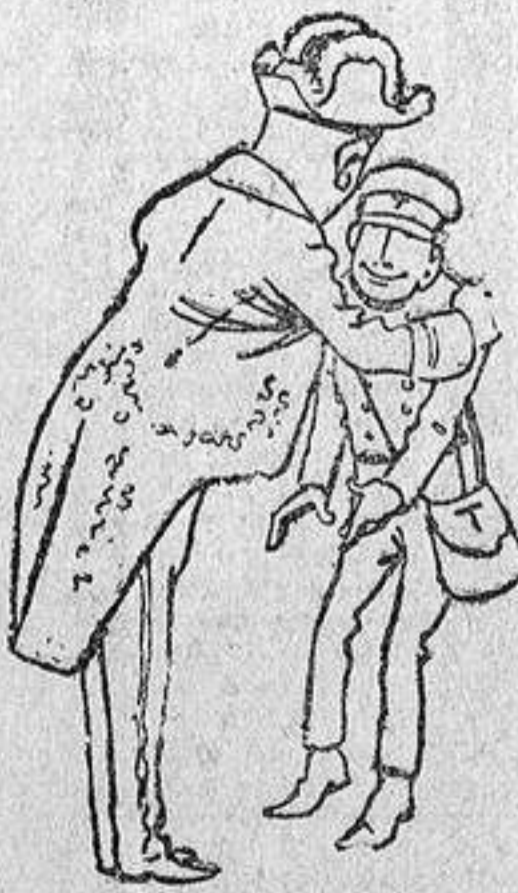
EL VIERNES, A LAS SIETE DE LA TARDE. — ¡Hijo de mis entrañas, a mis brazos!