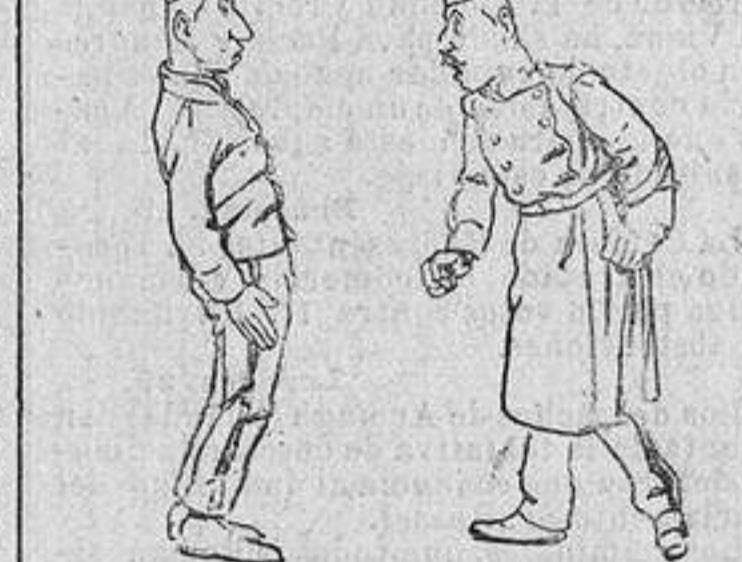
—¡Al revés, barbaro! Pero ¡qué es la mano izquierda!