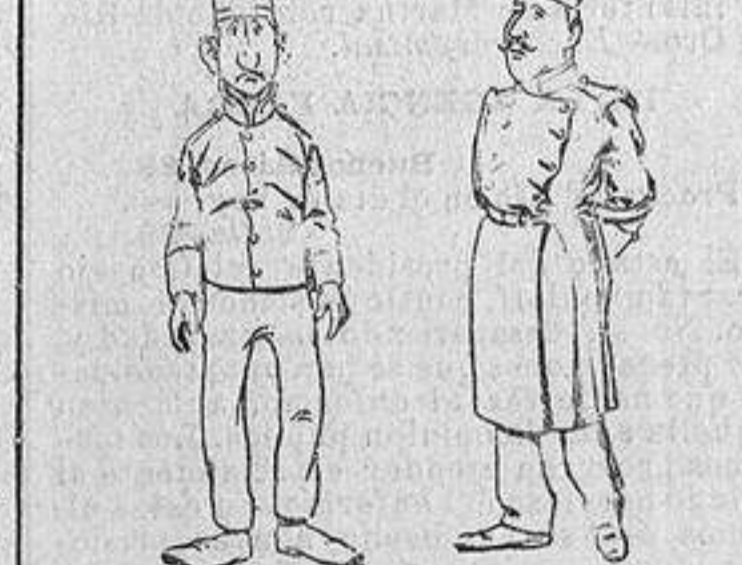
—Media vuelta á la derecha... ¡Marí!