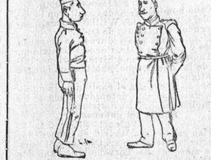
—Mucho cuidado, muchacho. Media vuelta á la izquierda... ¡Marí!

(DEL LIBRO DE ANGEL PONS Historietas, PUESTO HOY Á LA VENTA.)