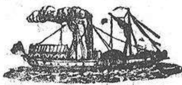
EL VAPOR ESPAÑOL