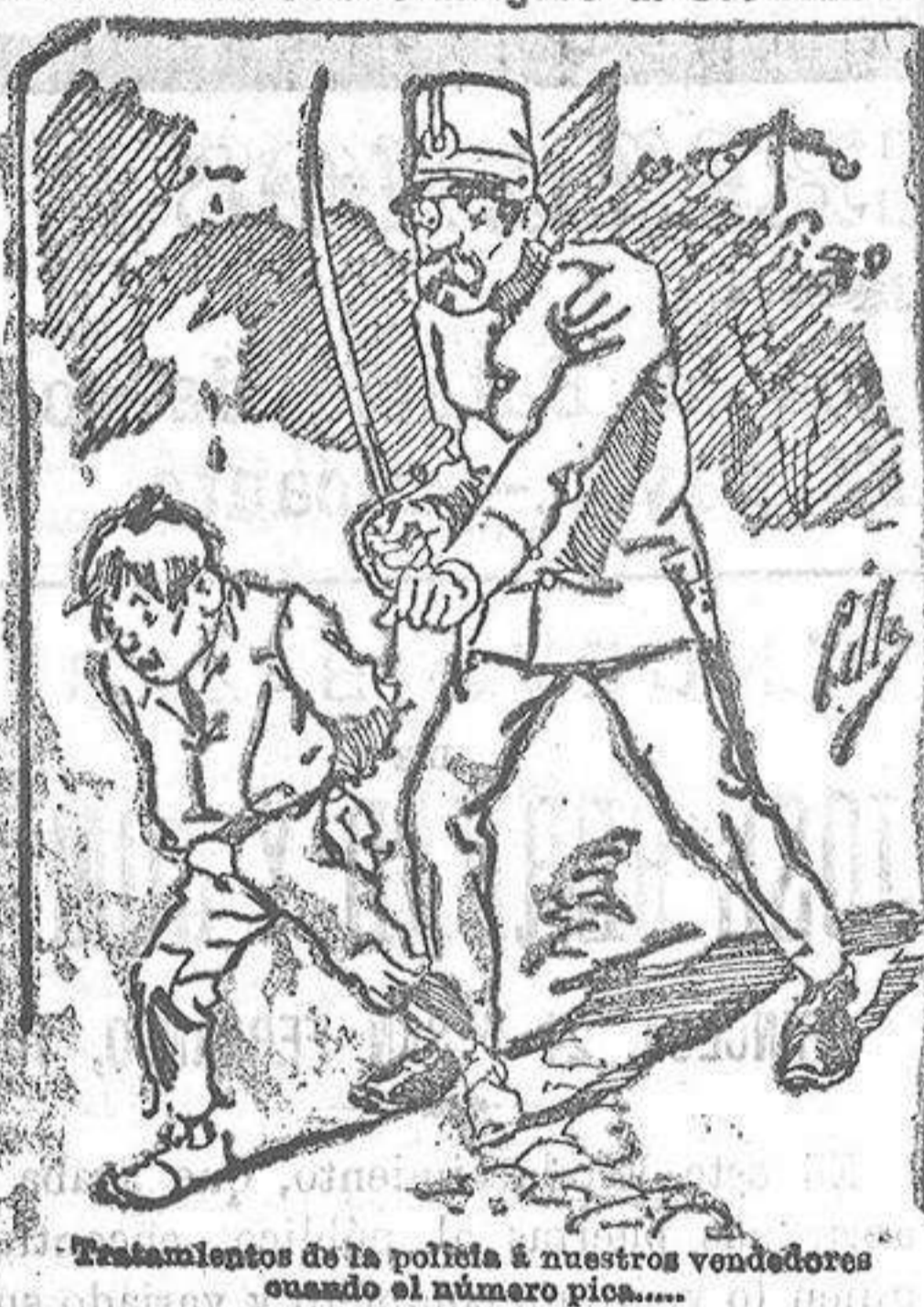
Tratamientos de la polifolia á nuestros vendedores cuando el número pica....

También puede pedirse LA AVISPA y el CATALOGO RESERVADO en casa de nuestros corresponsales autorizados, si no se quiere escribir á la Administración.