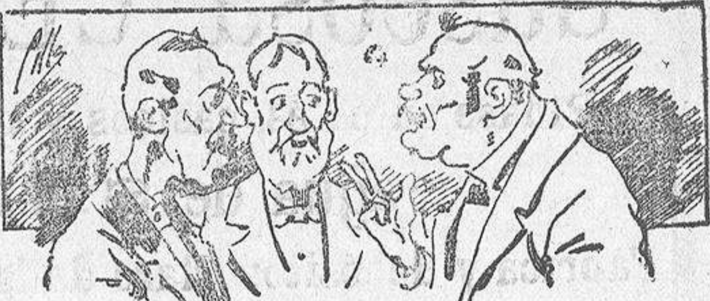
Abominan á nuestros libros....., pero los compran.

Todas las personas de gusto, curiosas é ilustradas deben pedir al Director de LA AVISPA, apartado núm. 8, MADRID, un ejemplar que se remite gratis y franqueado. Esta Revista Enciclopédica Popular publica recreaciones científicas, recetas de cocina, repostería, confitería, vinos, licores, pinturas, barnices, betunes y fórmulas para toda clase de industria, y cuantas noticias y conocimientos puedan ser beneficiosos. Cuenta además con buenos grabados, parte literaria excelente; da regalos mensuales á sus lectores con la Lotería Nacional y participaciones en la misma, á cuyo efecto compra todos los sorteos, y en una de las Administraciones más afortunadas por la suerte, billetes enteros. La suscripción y los números que se nos piden se sirven gratuitamente á correo vuelto y franqueados, con sólo indicar el nombre y dirección del que lo desea en sobre dirigido al Sr. Administrador de