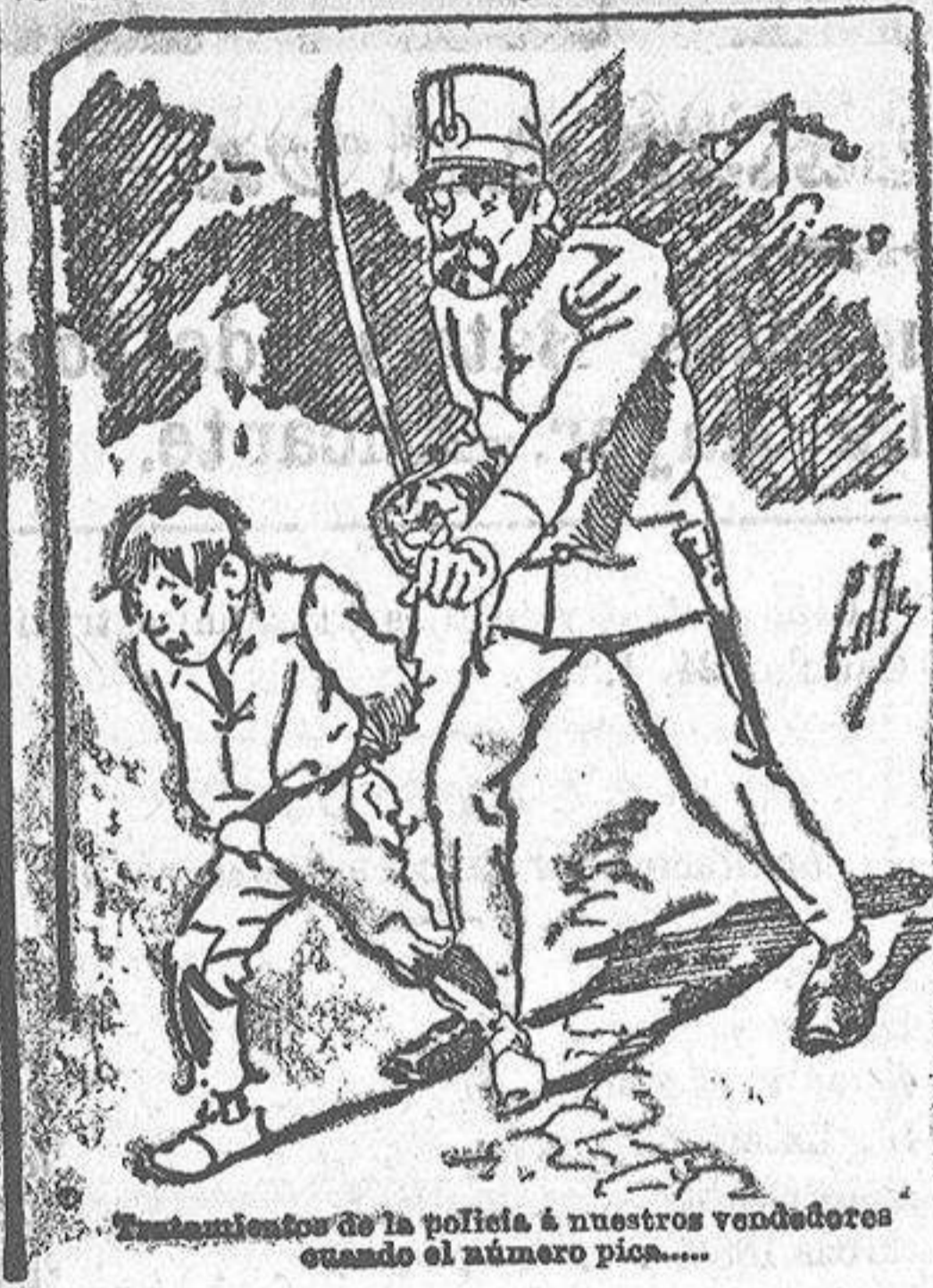
Entusiasmo de la policía á nuestros vendedores cuando el número pica....

También puede pedirse LA AVISPA y el CATALOGO RESERVADO en casa de nuestros corresponsales autorizados, si no se quiere escribir á la Administración.