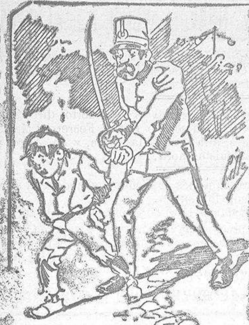
Tratamientos de la pelofia á nuestros vendedores cuando el número pica....

También puede pedirse LA AVISPA y el CATALOGO RESERVADO en casa de nuestros corresponsales autorizados, si no se quiere escribir á la Administración.