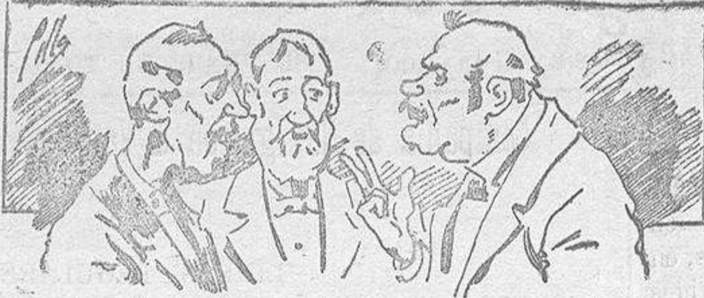
Abominan á nuestros libros..... pero los compran.

Todas las personas de gusto, curiosas ó ilustradas deben pedir al Director de LA AVISPA, apartado núm. 8, MADRID, un ejemplar que se remite gratis y franqueado. Esta Revista Enciclopédica Popular publica recreaciones científicas, recetas de cocina, repostería, confitería, vinos, licores, pinturas, barnices, betunes y fórmulas para toda clase de industria, y cuantas noticias y conocimientos puedan ser beneficiosos. Cuenta además con buenos grabados, parte literaria excelente; da regalos mensuales á sus lectores con la Lotería Nacional y participaciones en la misma, á cuyo efecto compra todos los sorteos, y en una de las Administraciones más afortunadas por la suerte, billetes enteros. La suscripción y los números que se nos pidan se sirven gratuitamente á correo vuelto y franqueados, con sólo indicar el nombre y dirección del que lo desea en sobre dirigido al Sr. Administrador de