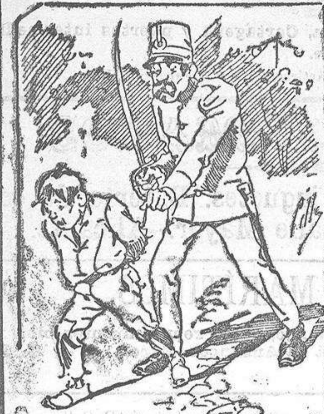
Tratamientos de la polifía á nuestros vendedores cuando el número pica.....