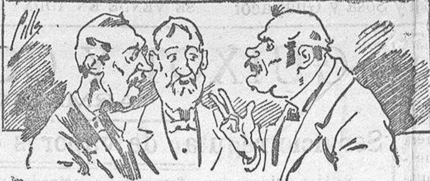
Abominan á nuestros libros....., pero los compran.

Todas las personas de gusto, curiosas é ilustradas deben pedir al Director de LA AVISPA , apartado núm. 8, MADRID, un ejemplar que se remite gratis y franqueado. Esta Revista Enciclopédica Popular publica recreaciones científicas, recetas de cocina, repostería, confitería, vinos, licores, pinturas, barnices, betunes y fórmulas para toda clase de industria, y cuantas noticias y conocimientos puedan ser beneficiosos. Cuenta además con buenos grabados, parte literaria excelente; da regalos mensuales á sus lectores con la Lotería Nacional y participaciones en la misma, á cuyo efecto compra todos los sorteos, y en una de las Administraciones más afortunadas por la suerte, billetes enteros. La suscripción y los números que se nos piden se sirven gratuitamente á correo vuelto y franqueados, con sólo indicar el nombre y dirección del que lo desea en sobre dirigido al Sr. Administrador de