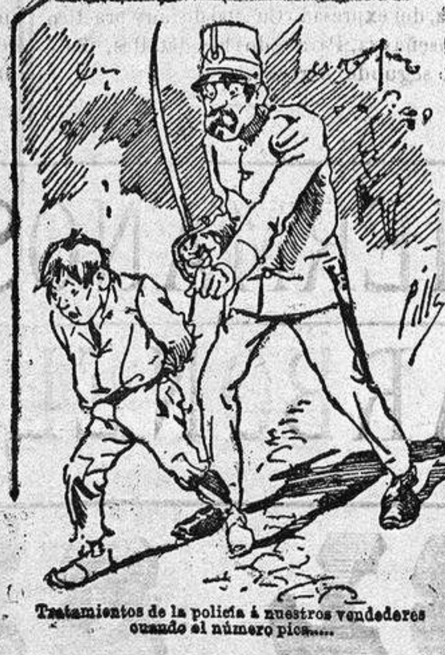
Tratamientos de la polifía á nuestros vendedores cuando el número pide...

También puede pedirse LA AVISPA y el CATALOGO RESERVADO en casa de nuestros corresponsales autorizados, si no se quiere escribir á la Administración.