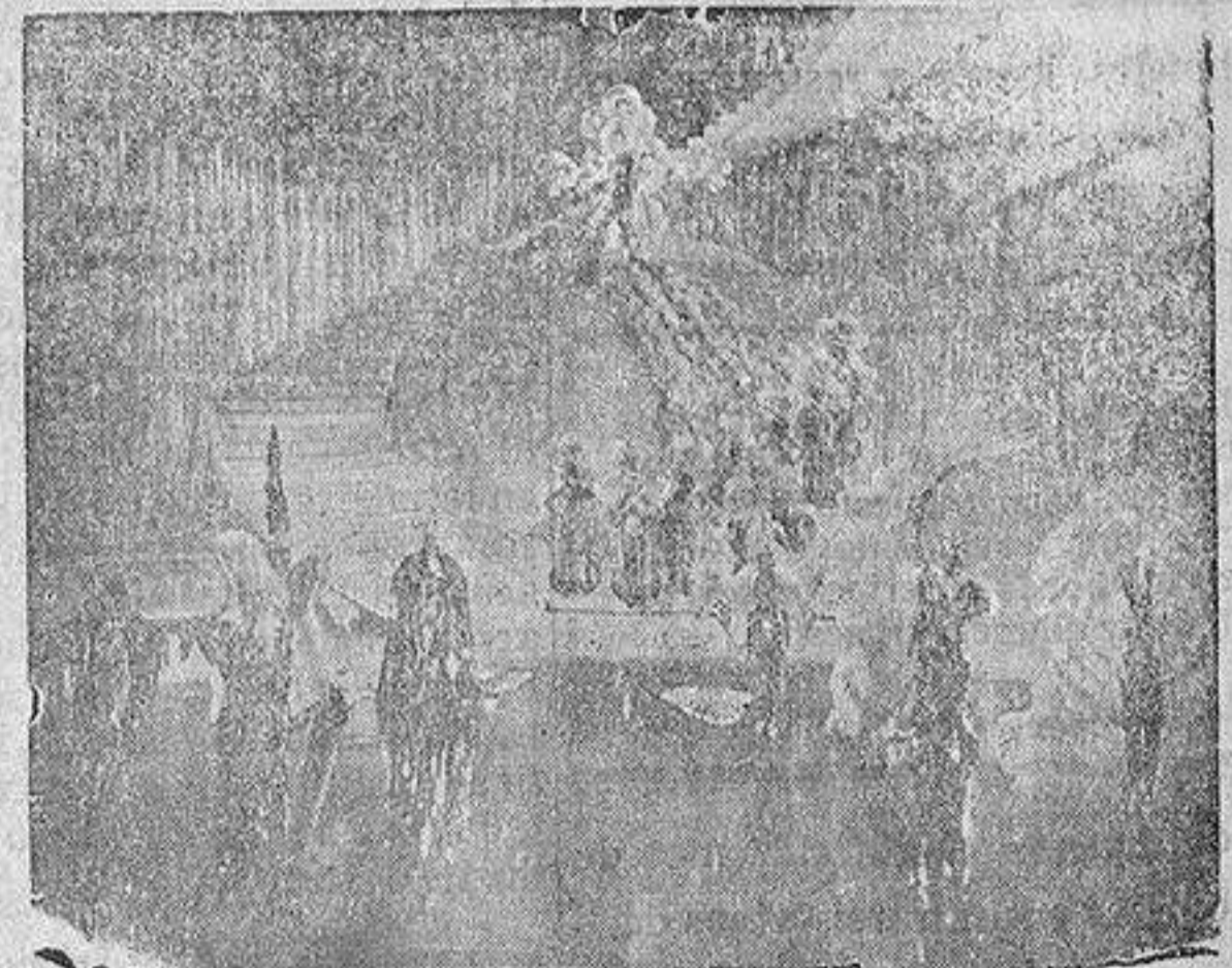
Una escena de la producción M. G. M. «El Gran Ziegfeld», película que evoca la vida del gran empresario americano. En esta producción William Powell y Myrna Loy alcanzan un triunfo ruidoso.