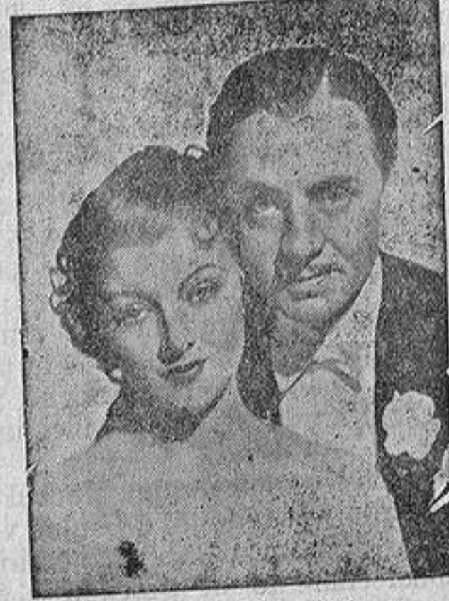
William Powell y Myrna Loy

Florence Ziegfeld, el famoso empresario norteamericano, símbolo del moderno espectáculo teatral y creador de la hoy tan difundida «Revista Musical», era un hombre ambicioso... Sabido es lo que significa presentar una de esas grandes producciones en el Broadway Neoyorquino... el público cosmopolita de New York, azeado a considerar un rascacielos, al-