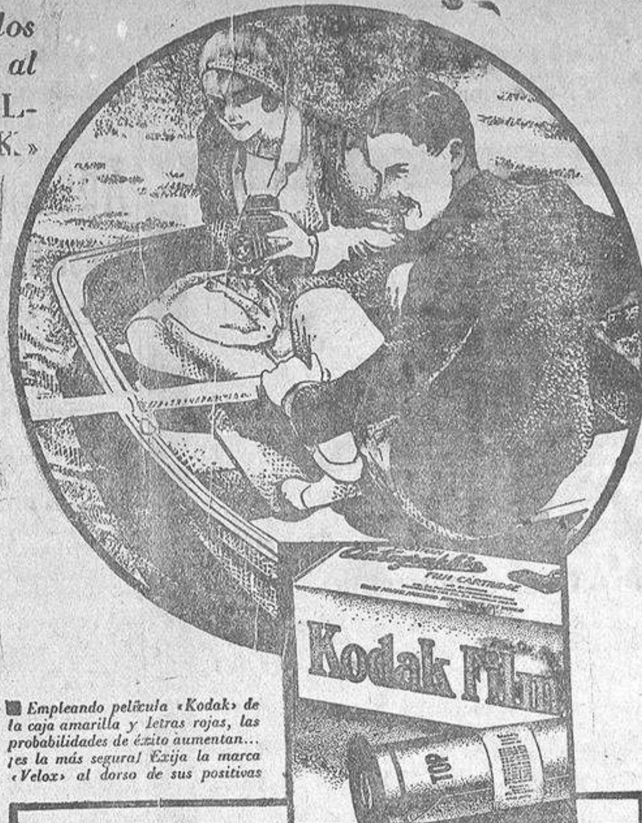
Empleando película «Kodak» de la caja amarilla y letras rojas, las probabilidades de éxito aumentan... ¡es la más segura! Exija la marca «Velox» al dorso de sus positivos.

No hace falta usar aparatos costosos ni complicados; puede usted servirse del más sencillo «Brownie» o «Kodak» cuyo fácil manejo aprenderá en sólo unos minutos.